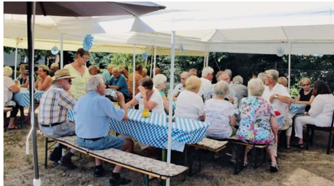
Ein bayerischer Nachmittag beim KGV Heidberg