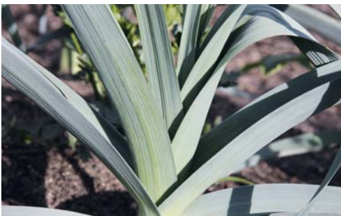
Wer im Winter Porree ernten will, sollte Wintersorten anbauen.

Das Wintergemüse schlechthin stellt der Grünkohl dar ( Brassica oleracea acephala var. sabellica ). In Norddeutschland ist dieses Gemüse sehr weit verbreitet. Bekannt