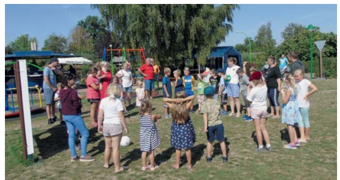
Kinderfest im KGV Hermannshöh

Termine: 06.10., Erntedankfest. Bitte beachtet die Aushänge in den Schaukästen.