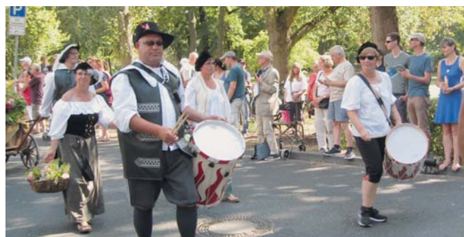
Gfr des KGV Linden beteiligten sich als Landsknechte und Marketenderinnen am Festumzug in Wolfenbüttel