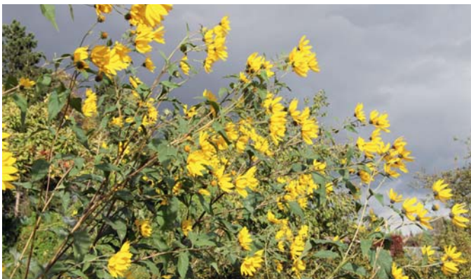
Topinambur ist nicht nur eine schöne Zierpflanze, sondern liefert im Winter auch leckeres Gemüse.

Die bekanntesten Sorten sind 'Halbhoher Grüner Krauser' und 'Lerchenzungen'. Diese sind jedoch nur mittelfrosthart. Die Sorte 'Redbor' mit dunkelvioletten Blättern macht sich auch im Blumenbeet sehr gut und ist sehr frosthart. 'Roter Krauskohl' ist eine Neuzüchtung aus drei alten Sorten mit leicht rötlichen Blättern. Auch die Sorte 'Winterbor' hat eine sehr hohe Frosthärte.