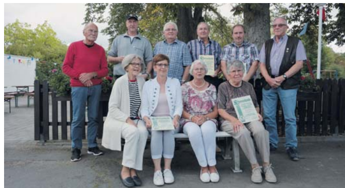
Die Geehrten vom KGV Mutterkamp e.V.

Die Wasserspritze sorgte für eine kleine Erfrischung, die Kinder hatten natürlich viel Spaß. Allen fleißigen Helfern ein herzliches Dan-