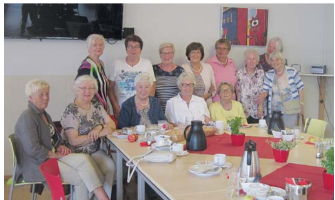
Die Gfr des KGV Katzenmeer genossen ein gemeinsames Frühstück.