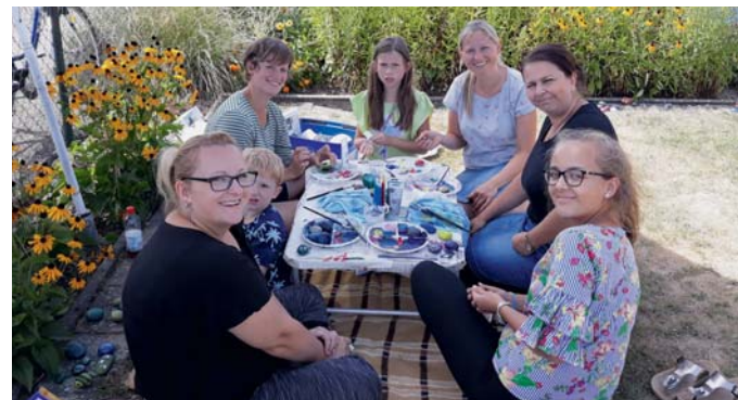
Beim Sommerfest des KGV Auf dem Klei konnten die Kinder Steine bemalen.