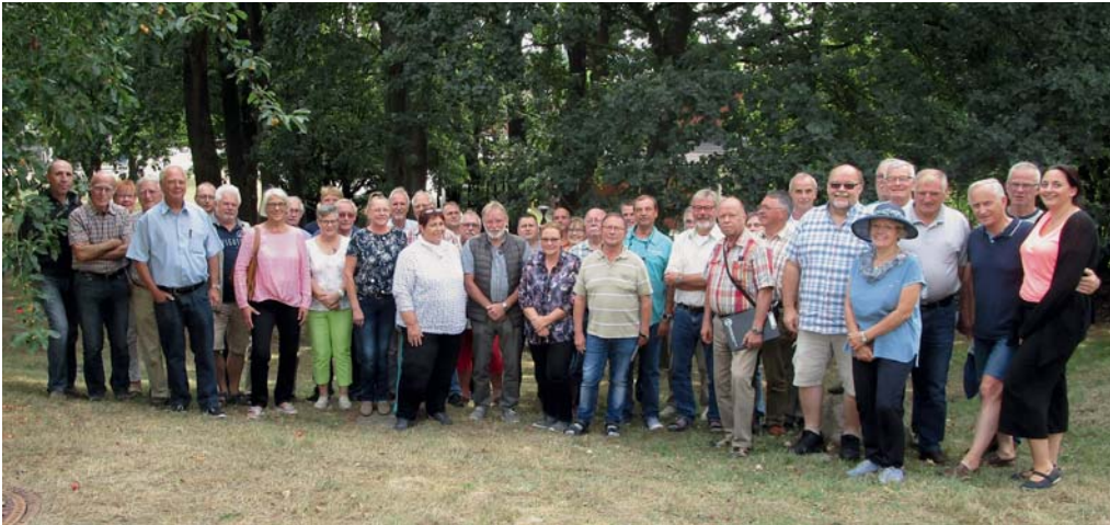
Die Teilnehmer des rundum gelungenen Seminars

Fachberater-Seminar vermittelte viel Wissen im Bereich Naturschutz