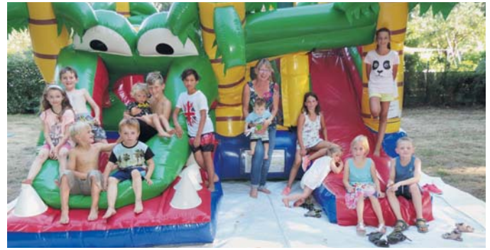
Hüpfburg beim Kinderfest des KGV Sonniges Land

Unser geselliger Nachmittag mit Kinderfest war trotz der Hitze sehr gut besucht, die Kinder waren mit Spielen und Wettkämpfen stets