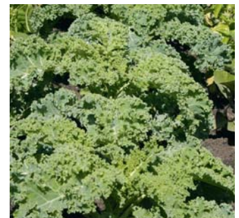
Das klassische Wintergemüse in Norddeutschland ist der Grünkohl.