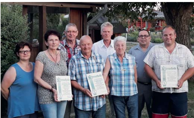
Geehrte Gfr des KGV Sonnenland

Unser Grillabend wurde auf den 06.10. ab 18 Uhr verschoben, Anmeldung ist noch kurzfristig bis zum 03.10. möglich. Die HJV findet am 13.10. um 15 Uhr statt, die Tagesordnung ist dem Aushang zu entnehmen. Anmeldung für die Halloweenfeier bitte bis zum 21.10.