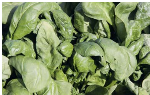
Spinat ist für eine Herbst- und Winterkultur ideal.