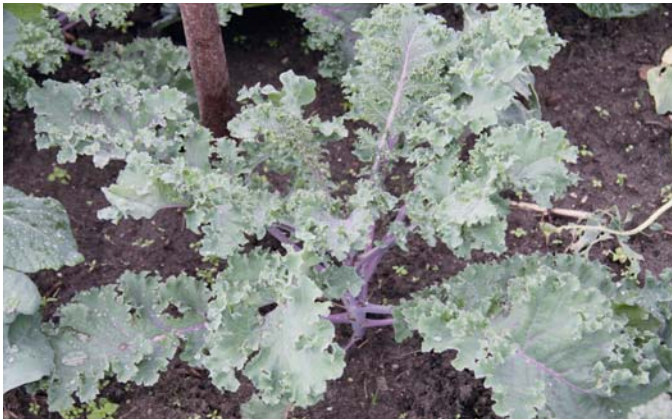
Die Sorte 'Braunkohl Roter Krauskohl' ist eine Neuzüchtung aus drei alten Sorten.

ist, dass Grünkohl vor der Ernte mindestens einmal dem Frost ausgesetzt sein muss, sonst schmeckt er nicht. Bei Kälteeinwirkung bildet sich in den Blättern vermehrt Zucker, der den Grünkohl milder werden lässt.