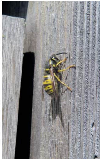
Eine Wespe raspelt Holz für den Nestbau.

Wespen leben nur einen Sommer lang. Spätestens im Oktober verlassen sie ihre kunstvoll aus Speichel und kleingekautem Holz hergestellten Nester und sterben. Haben Sie schon mal eine Wespe auf Holz beobachtet? Sie können genau sehen und auch hören, wie sie Holz abschabt und fortträgt.