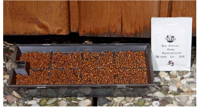
Diese Kresse-Anzuchtschale hat unter dem Sieb, auf das die Samen gestreut werden, einen Hohlraum für Wasser. Es braucht nur alle paar Tage Wasser nachgefüllt zu werden.