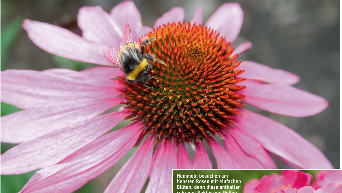
Der Rote Sonnenhut ist eine ideale Hummel-Futterpflanze.

Hummeln besuchen am liebsten Rosen mit einfachen Blüten, denn diese enthalten sehr viel Nektar und Pollen. Das gilt übrigens für alle unsere Zierpflanzen.