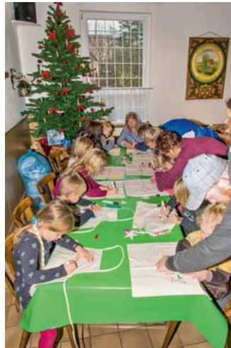
Weihnachtsfeier im KGV Im Holzmoore: Kinder bemalen eifrig Schürzen und Kissen.

Für diesen Monat stehen keine Vereinstermine an, noch liegt alles brach und wir warten auf das lang ersehnte Frühjahr. Kommt trotzdem regelmäßig in Eure Gärten vorbei, um nach dem Rechten zu schauen. Unsere Weihnachtsfeier im Dezember war mit 15 angemeldeten Kindern gut besucht, es gab Kaffee, Kekse und selbst gebackenen Kuchen. Danke an die edlen Spender! Die Kinder bemalten Schürzen oder Kissenbezüge, die sie dem Weihnachtsmann später ganz stolz präsentierten. Auch das eine oder andere Gedicht oder Lied wurde ihm dargeboten. Der Weihnachtsmann