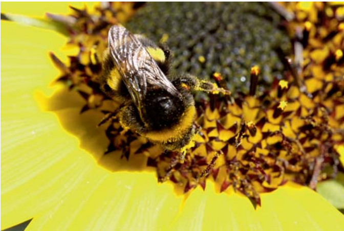
Einjährige Sonnenblumen sind in der Kultur einfach und ziehen Hummeln magisch an. Auf ihren großen Blütenböden lassen sich die Hummeln besonders gut beobachten.