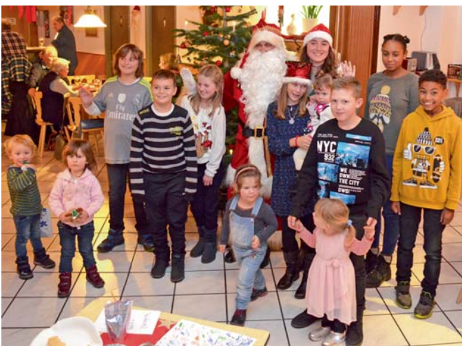
Groß und Klein freuten sich über den Besuch des Weihnachtsmannes im KGV Sonniges Land.

Im Dezember fand wieder die Kinderweihnachtsfeier statt. Die kleinen und auch größeren Kinder haben fleißig Insektenhotels für ihre Gärten gebaut und bunt angemalt.