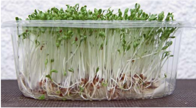
Kresse lässt sich leicht in einer durchsichtigen Kunststoffschachtel auf Küchenpapier anziehen.