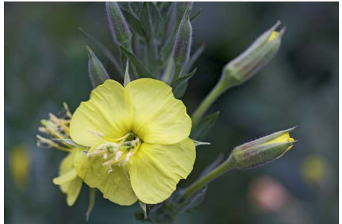
Weil Hummeln bis in die Dämmerung hinein auf Nektarsuche sind, werden sie auch von nachtblühenden Pflanzen wie der Einjährigen Nachtkerze angezogen.