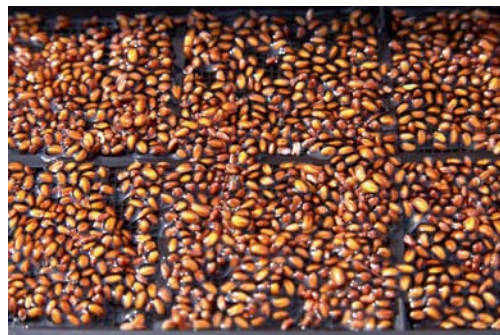
Kressesamen nehmen sehr schnell Wasser auf, und es entsteht eine gallertige Schicht um jedes Samenkorn.