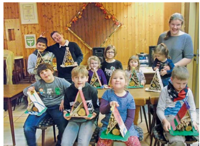
Kinder des KGV Hermannshöh präsentierten stolz ihre selbst gebastelten Insektenhotels.