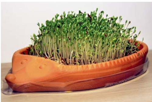
Ein begrünter Kresseigel sieht hübsch aus, muss jedoch zweimal am Tag auf genügend Feuchtigkeit geprüft werden, sonst trocknet die Saat aus.