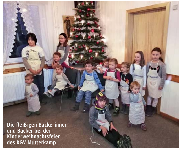
Die fleißigen Bäckerinnen und Bäcker bei der Kinderweihnachtsfeier des KGV Mutterkamp

Dann kam der Weihnachtsmann zu Besuch. Er erzählte eine Weihnachtsgeschichte und die Kinder, von klein bis fast groß, trugen dem Weihnachtsmann ihre Gedichte vor.