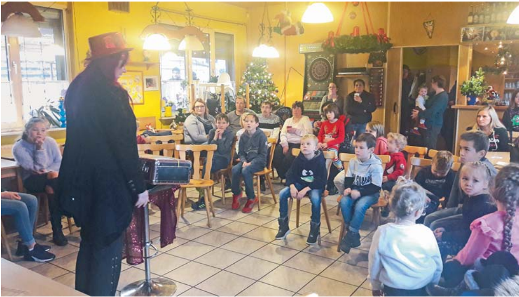
Auf der Weihnachtsfeier des KGV Schwarze Berge wurde mächtig gezaubert.