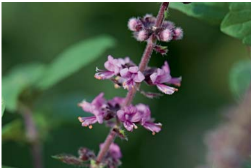
Basilikumsorten mit rot überhauchten oder roten Blättern haben rosa Blüten.