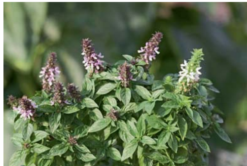
Blühendes Basilikum ist ein Insektenmagnet, jedoch zum Würzen ist es dann nicht mehr geeignet.