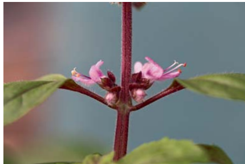
Die Blätter und Blüten des Basilikums sind gegenüber, d.h. sie stehen sich direkt gegenüber.