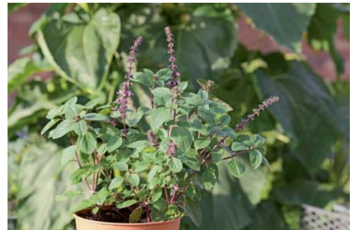
Aus jedem Trieb der Pflanze lässt sich ein Steckling ziehen: einfach in Erde stecken und gut feucht halten.

ganzen Topf in eine genügend große Plastiktüte und bindet sie oben mit einem Beutelclip zu. Sollte sich an der Wand des Bechers oder der Tüte Kondenswasser bilden, muss belüftet werden, damit das zu feuchte Substrat etwas abtrocknen kann – sonst verschimmelt die Saat.