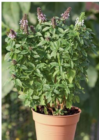
Pflanzen zum Würzen lassen sich besser im Topf kultivieren. Basilikum braucht viel Wasser.