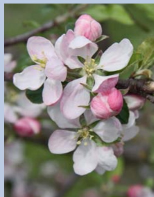
Mit der Apfelblüte beginnt der Vollfrühling.

Sonntag, 19.05., 9:00 Uhr, KGV Immergrün, Dannenbüttel, im Vereinsheim: „Richtige Bewertung“.