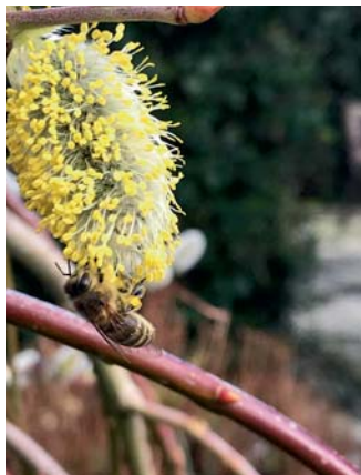
Frühling im KGV Heidehöhe: Die Bienen laben sich an den Weidenkätzchen.

Der Grüne Wink: Als ich noch Gärtnerlehrling war, – das liegt zurück schon viele Jahr – da gab's bei uns noch nicht die Frucht (Zucchini), sie stammt aus Südeuropas Zucht. Wolfram Oder