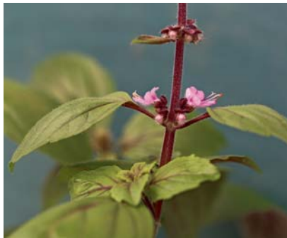
Basilikumblüten enthalten viel Nektar und Pollen.