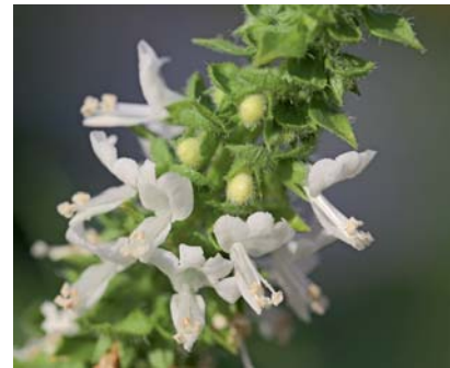
Grünblättrige Basilikumsorten blühen weiß.

Ab Mitte Mai können auch die frostempfindlichen Kulturen endlich ins Freie. Damit ist die Gartensaison eröffnet. Nicht nur in unserer Region spielen die „Eisheiligen“ eine große Rolle. Sie werden auch Eismänner oder gestrenge Herren genannt. Dabei handelt es sich um vier Namensepochen von Heiligen, genauer um Bischöfe und Märtyrer aus dem 4. und 5. Jahrhundert n. Chr.: Beginn ist am 11. Mai mit „Mamertus“, dann folgen „Pankrazi“ (12. Mai), „Servazi“ (12. Mai) sowie