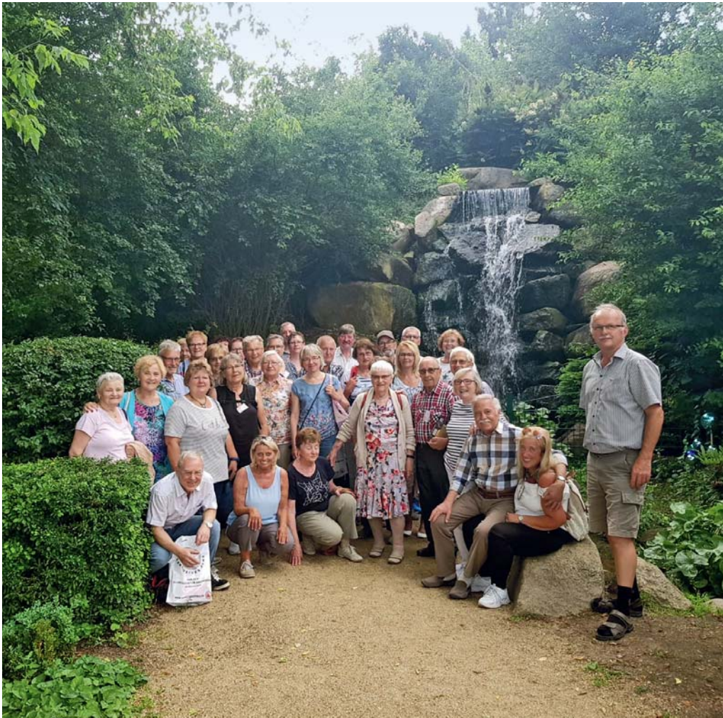
Die Vereinsfahrt des KGV Rote Schanze führte die Gfr nach Sangerhausen und Derenburg, wo sie einen abwechslungsreichen Tag verbrachten.