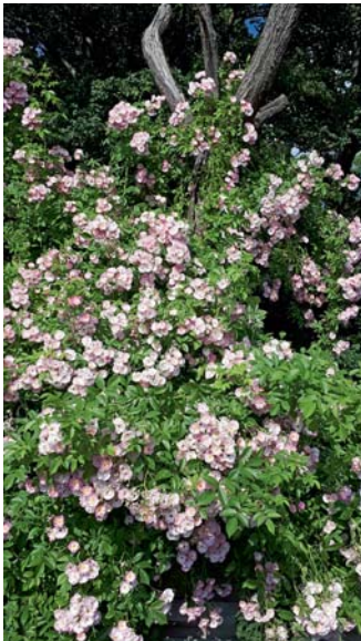
KGV Hopfenkamp: Die Kletterrose 'Apple Blossom' erobert den alten Pflaumenbaum.

stock mit einer anderen Einteilung hatte. Aber das wird auch noch, spätestens im Herbst. Für die „herrenlosen“ Hecken haben sich ebenfalls Gfr gefunden. Danke!