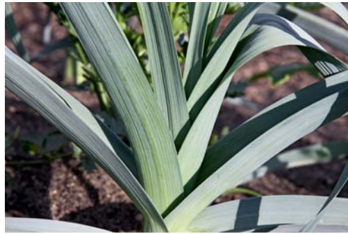
Wer im Winter Porree ernten will, sollte Wintersorten anbauen. Rechts: Topinambur ist nicht nur eine schöne Zierpflanze und wertvolle Insektenweide, sondern liefert im Winter auch leckeres Gemüse.

Die vorgezogenen Pflanzen sollten zwischen April und Mai an Ort und Stelle im gleichen Abstand wie Grünkohl gepflanzt werden. Rosenkohl sollte gut mit Kompost versorgt werden, denn er ist Starkzehrer. Die Röschen in den Blattachsen können den