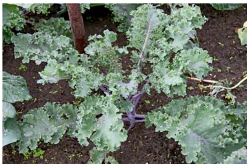
Die Sorte 'Braunkohl Roter Krauskohl' ist eine Neuzüchtung aus drei alten Sorten.