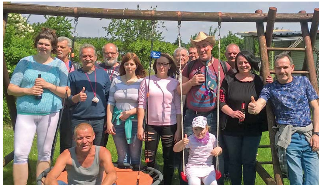
Gartenfreunde des KGV Einigkeit Hoiersdorf feierten den Vatertag.