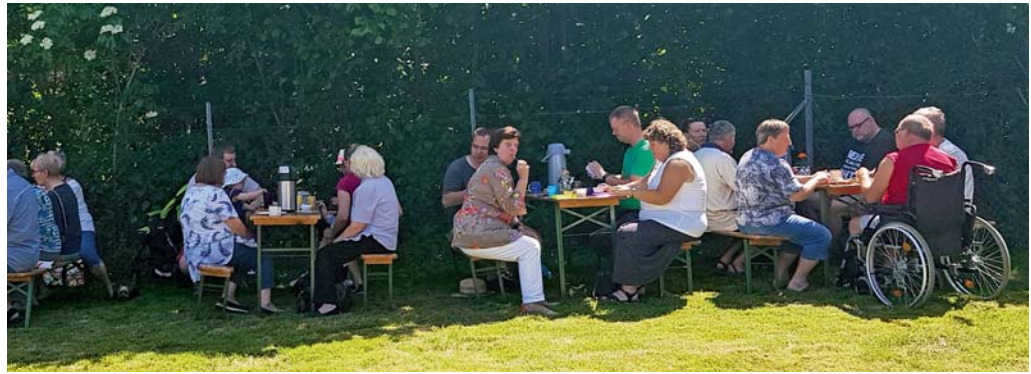
Kaffeeklatsch im KGV Asseblick

Die Vorbereitungen für unser Sommerfest am 10.08. ab 13 Uhr laufen schon auf Hochtouren. Für die Kinder gibt es in diesem Jahr neben allerlei lustigen und interessanten