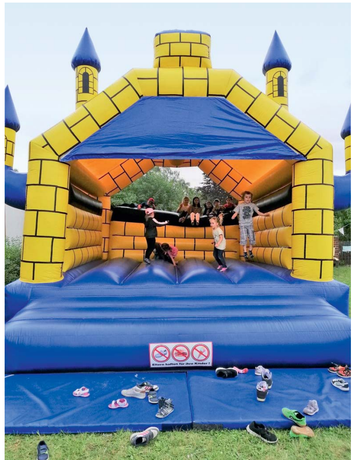
KGV Am Weinberg: Am Himmelfahrtstag war die Hüpfburg bei den Kindern sehr beliebt.

Am Himmelfahrtstag veranstaltete der Verein erstmalig einen Familientag. Väter hatten die Möglichkeit, mit ihrem Nachwuchs zu toben und