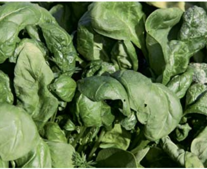
Spinat ist für eine Herbst- und Winterkultur ideal.

wirkung bildet sich in den Blättern vermehrt Zucker, der den Grünkohl milder werden lässt.