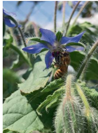
Die Kärntner Biene ( Apis mellifera carnica ) auf einer Borretschblüte

Für die Frühjahrsastern ist jetzt die ideale Pflanzzeit gekommen, damit diese bis zum Winter noch richtig einwurzeln können und im Frühjahr dann Vollgas geben. Um die Winterastern als letztes Bienenfutter zu pflanzen, ist der ideale Zeitpunkt dann wieder der Frühling. Bevor die letzten Beete über den Winter brach liegen, bietet sich neben Senf auch Phacelia oder Buchweizen als wertvolles Bienenfutter an. Hierzu müssen keine großen Flächen vorhanden sein, die Bienen finden ihr Winterfutter auch, wenn