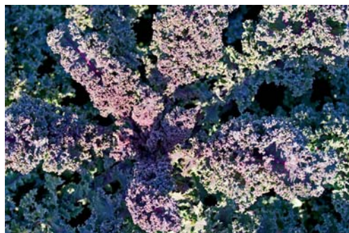
Farbige Grünkohlsorten erreichen ihre volle Ausfärbung erst nach den ersten Frösten.