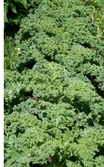
Das klassische Wintergemüse in Norddeutschland ist der Grünkohl.