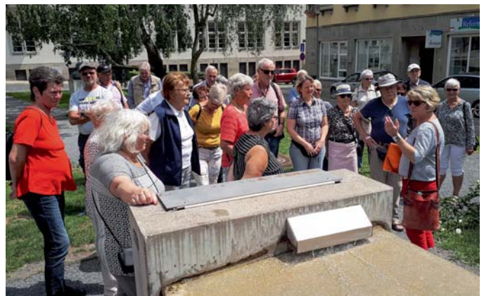
Die Schulungsfahrt des Bezirksverbandes Steintor führte im Juni auch nach Nordhausen. Dort nahmen die Gfr an einer Stadtführung teil.

Im Schweiß meines Angesichts schreibe ich diese Zeilen heute, am 26.06., dem bisher wärmsten Tag des Jahres. Der Heckenschnitt, für viele von uns bestimmt auch sehr schweißtreibend gewesen, ist fast durch. Und ich muss sagen, es sieht gut aus – bis auf die eine oder andere Hecke, wo der Gfr einen Zoll-