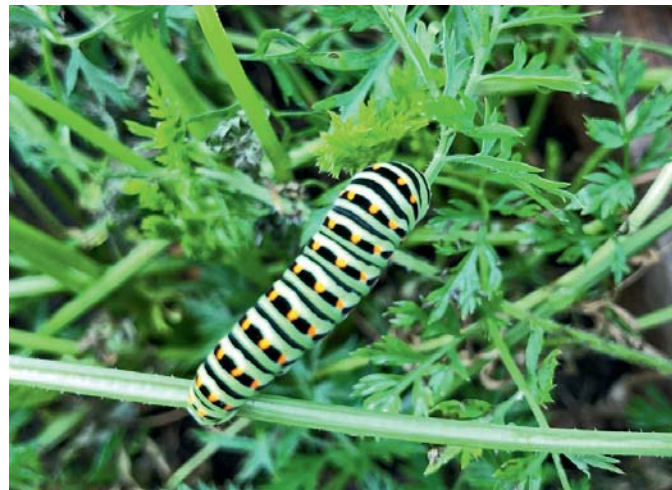
Die Raupen des Schwalbenschwanzes lieben Möhrenkraut.

Ich fange mit Schmetterlingen an. Auf meinen Möhren habe ich Mitte August eine Raupe des Schwalbenschwanzes entdeckt. Die Raupen dieses seltenen Schmetterlings lieben Möhrenkraut. Also einen Teil der Möhren über Winter stehen lassen, damit wir uns auch im nächsten Jahr