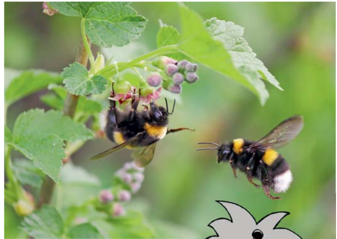
Die Blüten der Johannisbeeren sind bei den Hummeln sehr beliebt.

Daher ist es besonders wichtig, viele unterschiedliche Blüten im Garten zu haben, aus denen Hummeln Pollen und Nektar sammeln können und die vor allem auch zwischen Juni und August, den Monaten, in denen die meisten Hummeln verhungern, blühen.