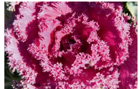
Zierkohl zieht im herbstlichen Garten alle Blicke auf sich.

Sonntag, 20.10., 9:00 Uhr, KGV „Immergrün“, Dannenbüttel, im Vereinsheim: „Winterharte Blütenstauden“.