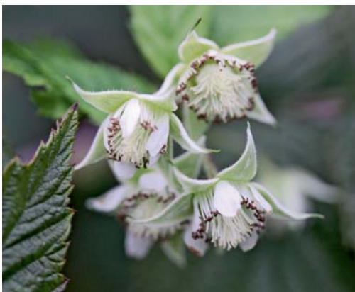
Die Blüten der Himbeere sind unscheinbar.

Mittelspäte bis späte Sorten für den Übergang zu den Herbsthimbeeren sind 'Korbfüller', 'Rubaca' (robust gegenüber Krankheiten), 'Schönemann' (stark wachsend und reich tragend), 'Tula Magic' und 'Tulameen'. 'Meeker', eine amerikanische Züchtung von 1967, treibt spät aus, hat aber einen enormen Zuwachs. Die Pflanze wirkt auch als einzeln stehender Strauch. Damit der Wuchs schön buschig bleibt, kann man sie im Spätherbst nach der Ernte