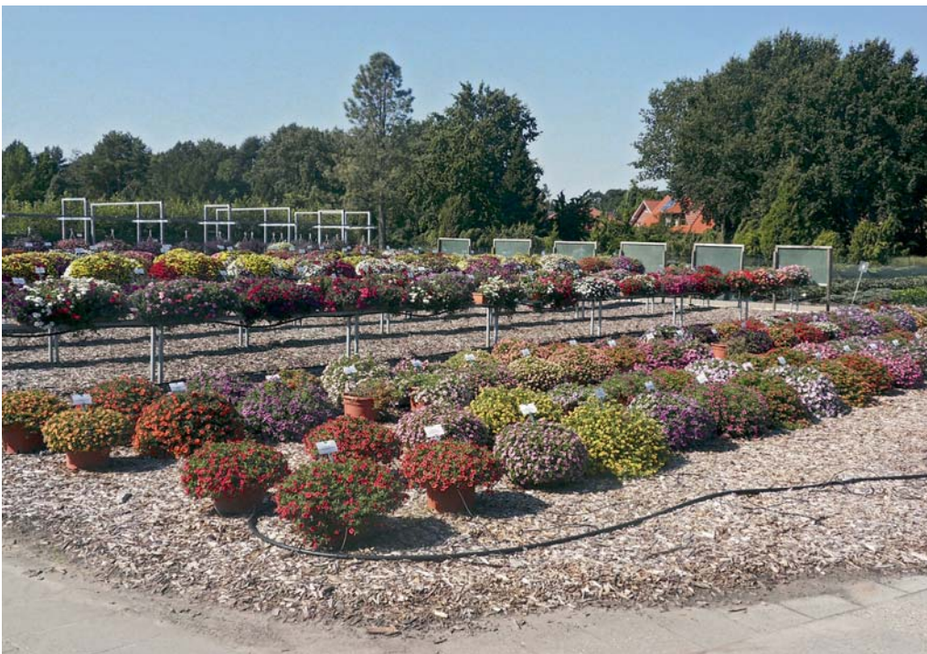
Bezirksverband Augusttor: Eine bunte Farbenpracht boten die Beet- und Balkonpflanzen im Park der Gärten in Bad Zwischenahn.

Termine: 19.10., 9–13 Uhr, Gemeinschaftsarbeit, Heckenschnitt; 26.10., 10–13 Uhr, Wasser abstellen und Wasserverbrauch 2019 feststellen, Stromverbrauch 2019 ablesen.