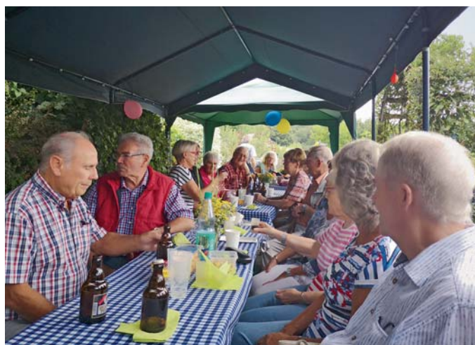
Gangfest im KGV Timmerlaher Busch