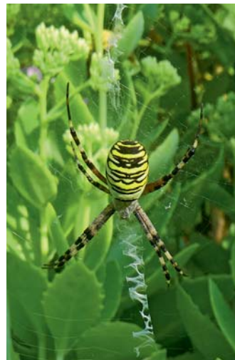
KGV Gunther: Dickblatt-Fettgewächs mit Wespenspinne in einem Kleingarten