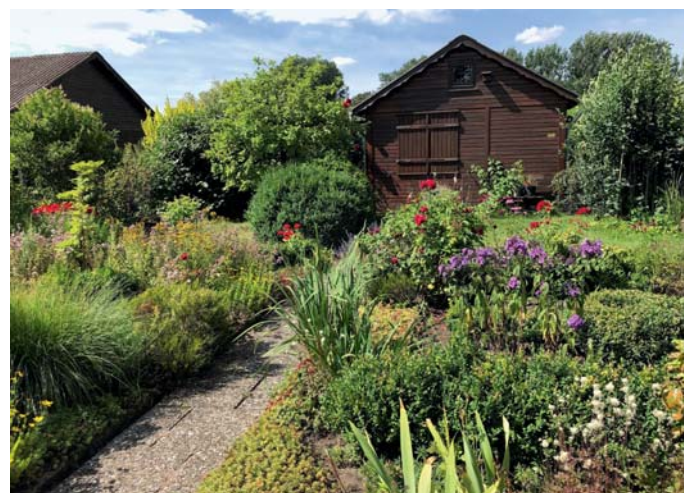
Bunte Pflanzenvielfalt im KGV Klostersgang

Wir bedanken uns einfach für die gute Zusammenarbeit mit den Gfr während den Besichtigungen. Im