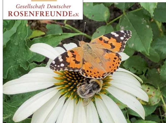
Auf Blüten tummeln sich Insekten im Sommer, sind sie doch deren Lebensgrundlage.