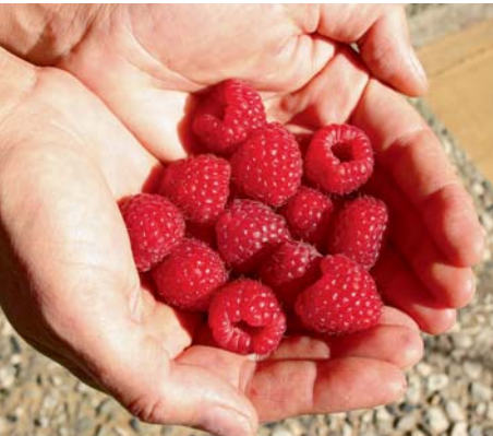
Heutige Züchtungen der Himbeere erlauben eine Ernte von Juni bis Oktober.

Jetzt ist die beste Pflanzzeit für Obstgehölze