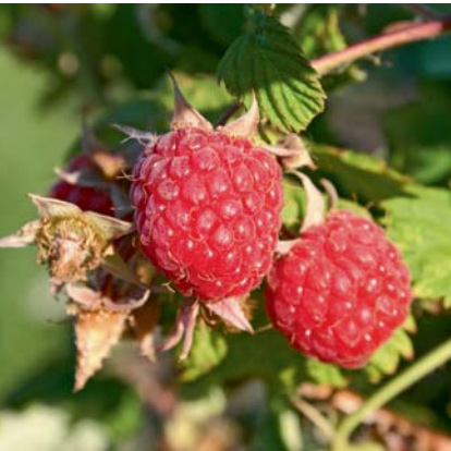
Reife Himbeeren sind nicht nur lecker, sondern auch gesund.