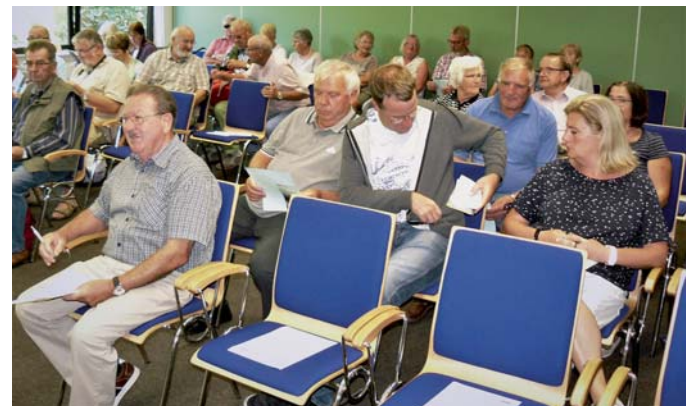
Die Seminarteilnehmer im Schulungsraum der Gartenakademie.