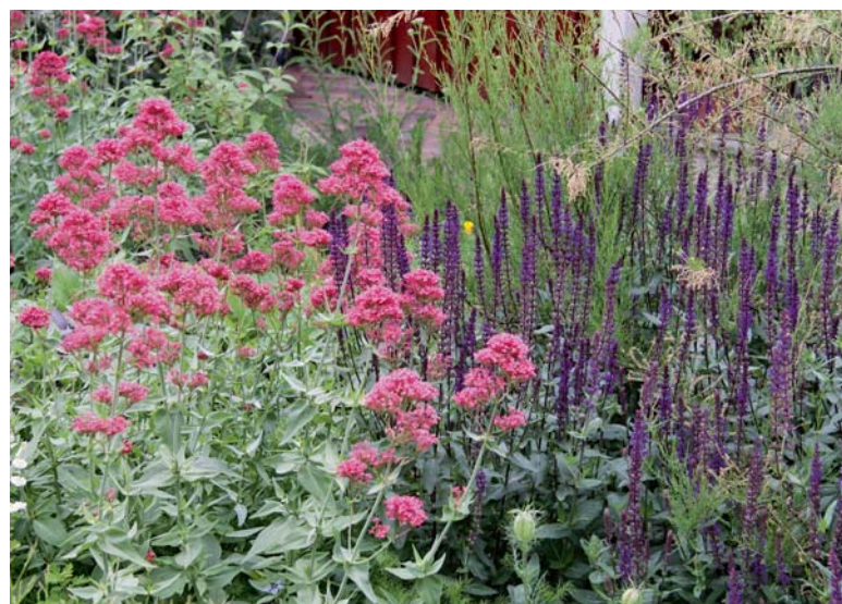
Die dunkelblauviolettten Blüten des Steppensalbeis unterstreichen die Blüten der Roten Spornblume.