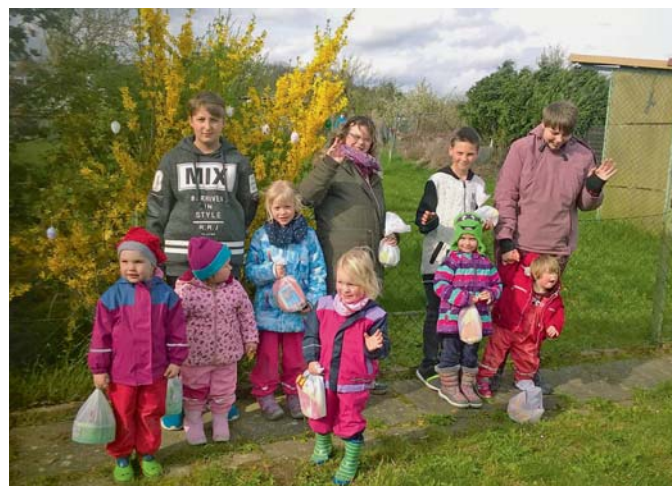
Erfolgreiche Ostereiersuche beim Nachwuchs des KGV Einigkeit Hoiersdorf