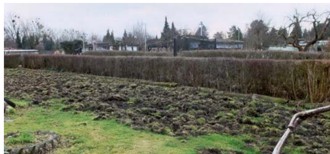
Eine Rotte Wildschweine verwüstete den Lagerplatz des KGV Mastbruch. Die Gärten wurden glücklicherweise verschont!