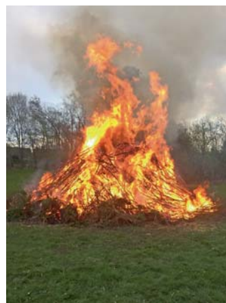
Hell loderten die Flammen im KGV Moorhütte.

Unser Grünschnittexpress war wieder ein Erfolg, fünf gut gefüllte Anhänger waren das Ergebnis. Der Frosteinbruch in der Nacht vom 19. zum 20.04. hat einige Wasserzähler zerstört. Gerade zu Anfang und zum Ende der Saison hört auf die Wettervorhersage und schützt entsprechend eure Wasserzähler!