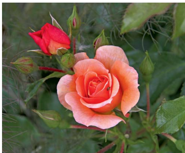
Im Juni ist die „Hochzeit“ der Rosenblüte. Die Sorte ‘Aprikola’ ist eine sehr blattgesunde Beetrose.

Freitag, 02.06., 19:00 Uhr, KGV Ibenkamp, Merverode, Eingang Milischstraße: „Gartenrundgang“. Um die benachbarten Vereine im Bezirk näher kennen zu lernen, werden regelmäßig in den Sommermonaten Gartenrundgänge in den Vereinen durchgeführt.