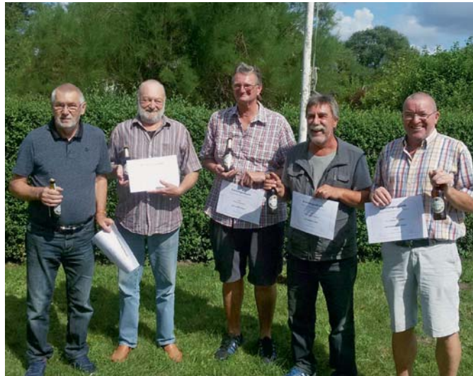
Ehrungen im KGV Stöckheim mal anders: Jeder Gfr mit dem Vornamen Klaus erhielt eine Urkunde und eine Flasche „Klaustaler“.

der hiermit ein herzliches Dankeschön. Fließend ging es über in ein gemütliches Beisammensein bei Cocktails, frisch Gezapftem und einem Grillstand, der für das leibliche Wohl sorgte, sodass wieder bis in die Nacht hinein gefeiert wurde.