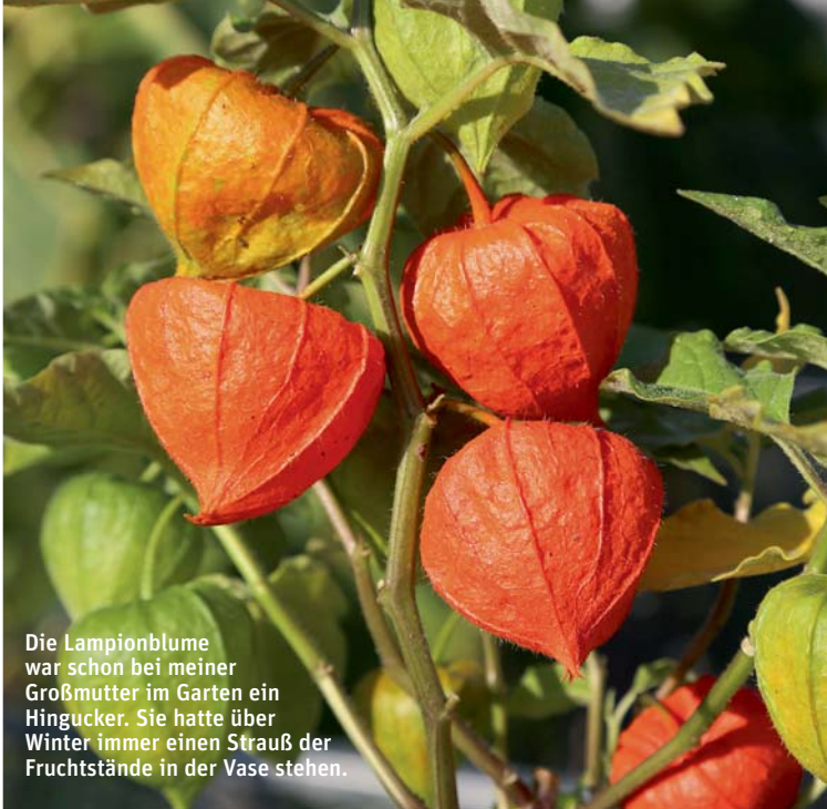
Die Lampionblume war schon bei meiner Großmutter im Garten ein Hingucker. Sie hatte über Winter immer einen Strauß der Fruchtstände in der Vase stehen.