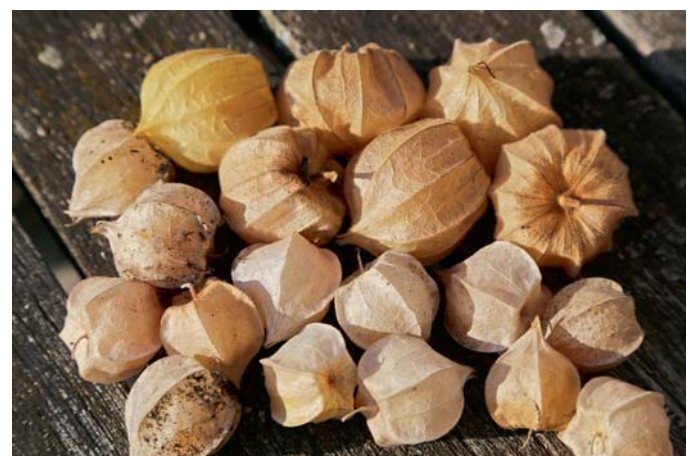
Die Andenkirsche und die Erdkirsche im Vergleich. Die Früchte sind fast gleich groß, die der Erdkirsche ist etwas heller, doch der Lampion der letzten ist kleiner.