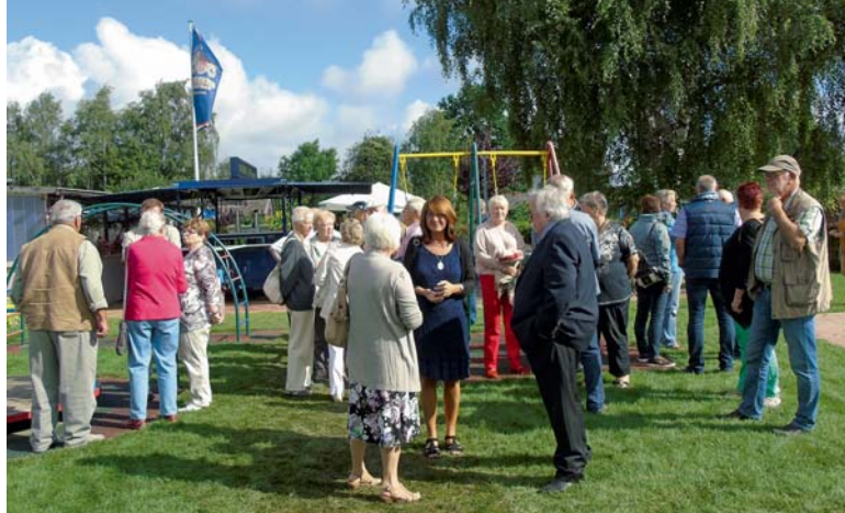
110-Jahrfeier im KGV Hermannshöh: Zu sehen sind die hungrigen Gfr vor dem traditionellen Katerfrühstück.