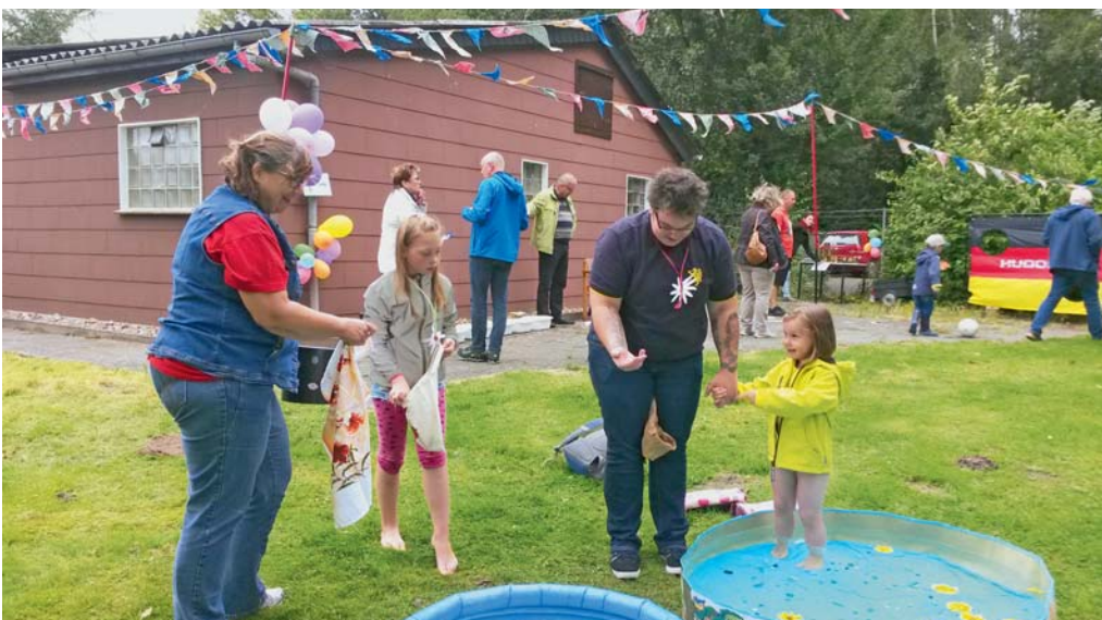
Trotz des wechselhaften Wetters hatten Klein und Groß Spaß beim Kinderfest des KGV Moorhütte.