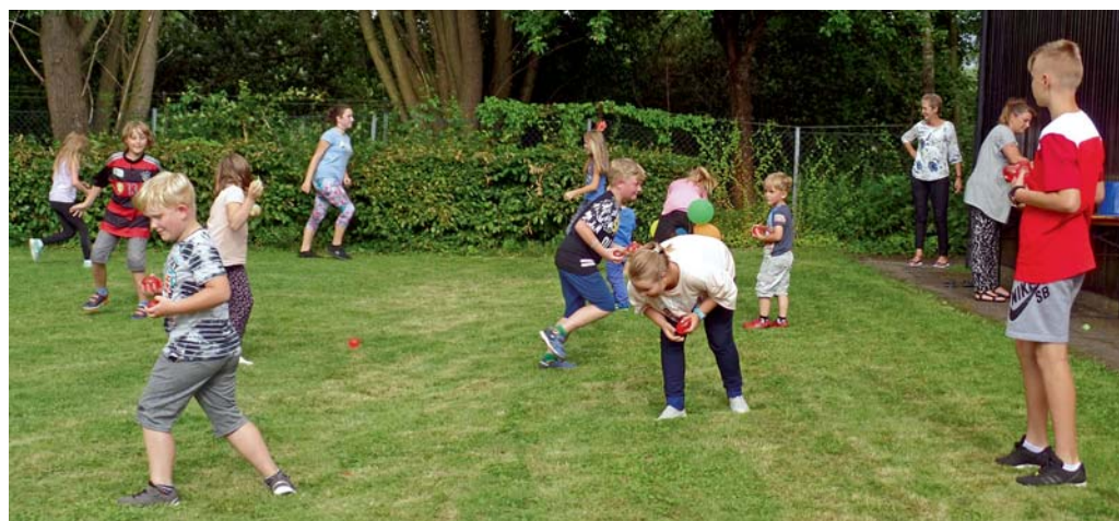
KGV Sonniges Land: Zum Ende des Kinderfestes gab es zur Abkühlung eine Wasserbombenschlacht.

Termine: 28.10., Haxenessen. Ehrentage: Am 06.10. feiert unser Gfr Helmut Buchheister seinen 85. Geburtstag. Wir gratulieren recht herzlich und wünschen alles Gute und Gesundheit.