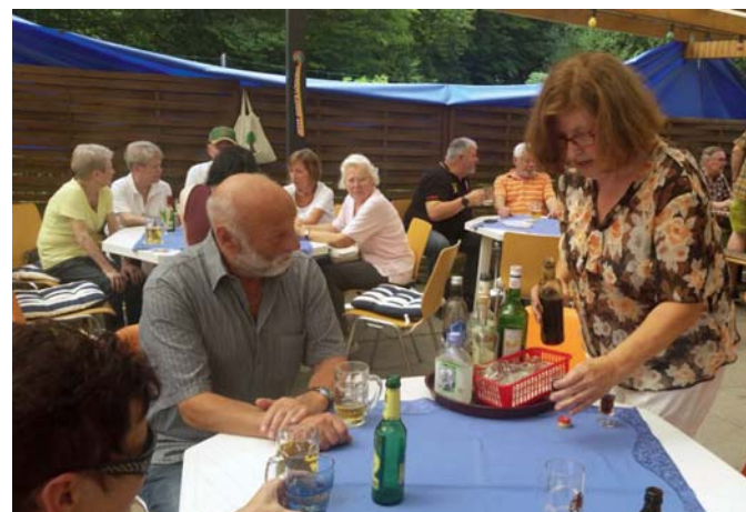
Geselliges Beisammensein beim Currywurstessen des KGV Kröppelberg