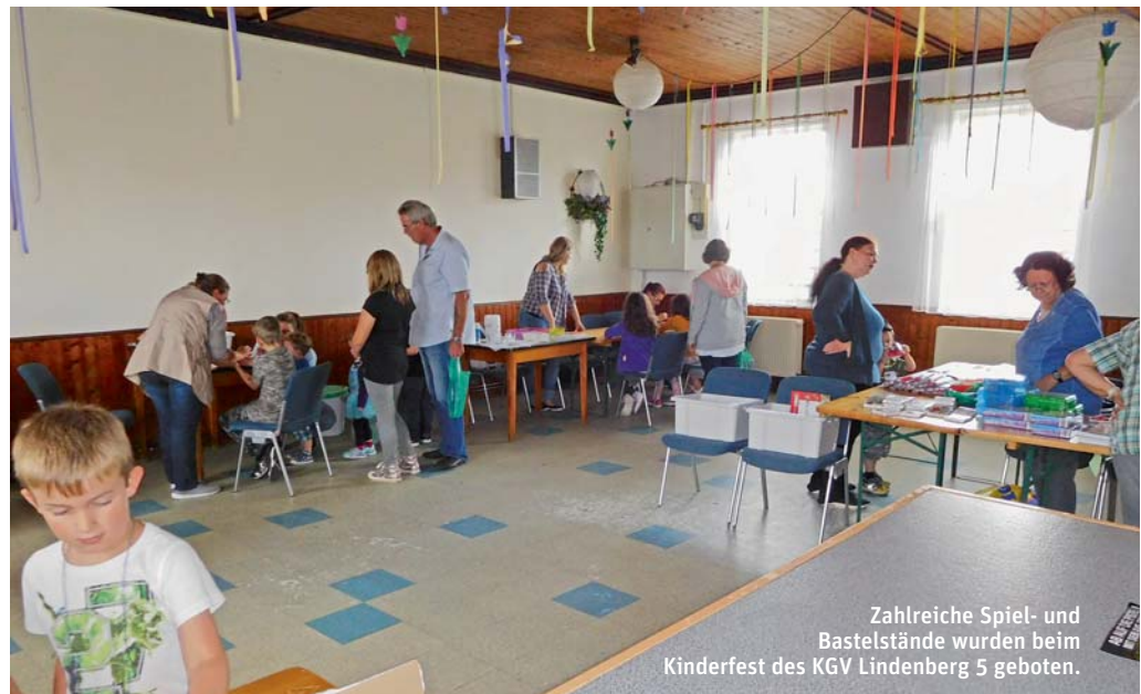
Zahlreiche Spiel- und Bastelstände wurden beim Kinderfest des KGV Lindenberg 5 geboten.

Termine: 21.10., Heckenschnitt und Container; 28.10., Wasser abstellen