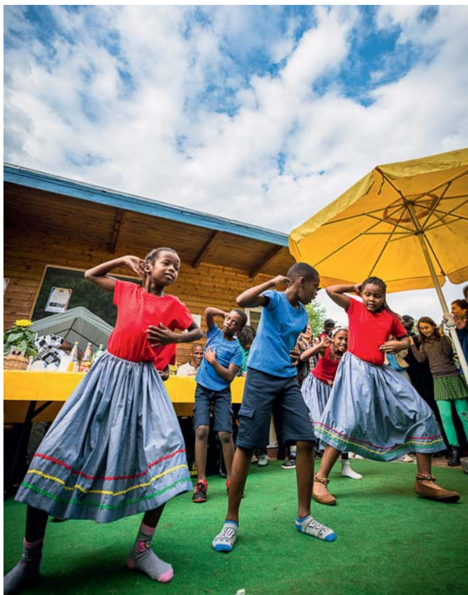
Die Kinder vom Haitianischen Kulturverein Niedersachsen begeisterten die Gäste mit ihrer Tanzvorführung.