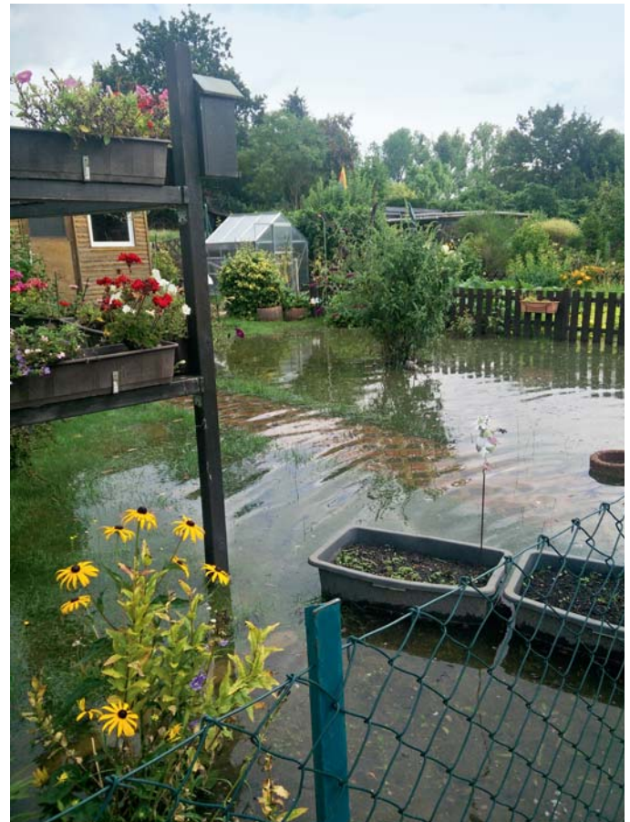
Etliche Gärten standen im KGV Dammweg unter Wasser.