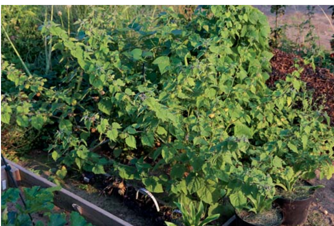
Die Andenkirsche braucht fast einen Quadratmeter Platz, denn die Pflanzen werden groß.

In den letzten Jahren sind nahe Verwandte der Lampionblume in unseren Gärten immer öfter anzutreffen. Sie gehören genauso wie sie zu den Nachtschattengewäch-