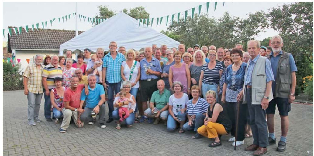
Sommerfest des KGV Gunther: Königin und König umgeben vom Gartenclan