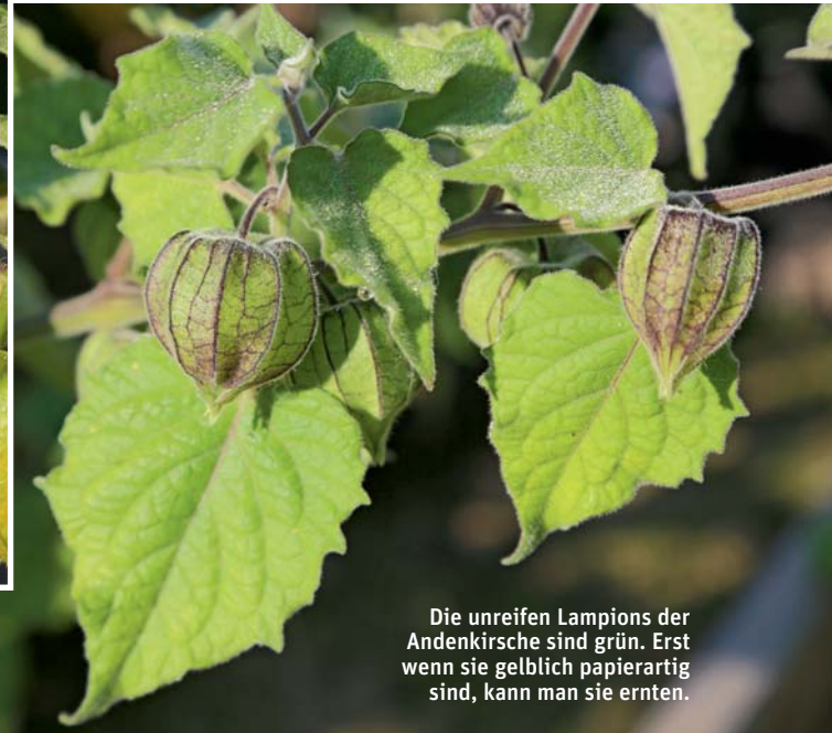
Die unreifen Lampions der Andenkirsche sind grün. Erst wenn sie gelblich papierartig sind, kann man sie ernten.