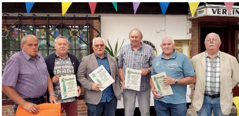
Ehrungen im KGV Kennelblick

Die Gartensaison neigt sich dem Ende und der Vorstand möchte wie jedes Jahr daran erinnern, die Gärten trotzdem regelmäßig zu besuchen, damit es keine bösen Überraschungen gibt.