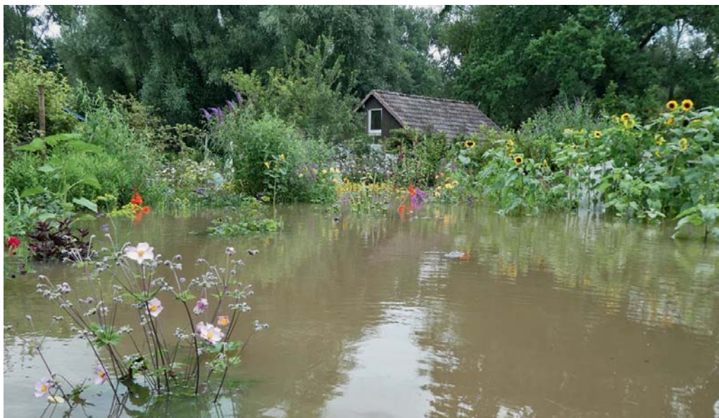
Auch die Gärten des KGV Nußberg blieben nicht vom Hochwasser verschont.

Eine schicke neue Gartenlaube, errichtet aus verschiedenen Bauelementen wie Containerholz, wurde in drei Monaten errichtet. Während der gemeinsamen Gartenarbeit kommt auch das leibliche Wohl nicht zu kurz, mit dem Wok wird traditionelles vietnamesisches Essen zubereitet. Dabei wandert schon mal das eine oder andere angebaute Gemüse aus dem Garten in den Topf.