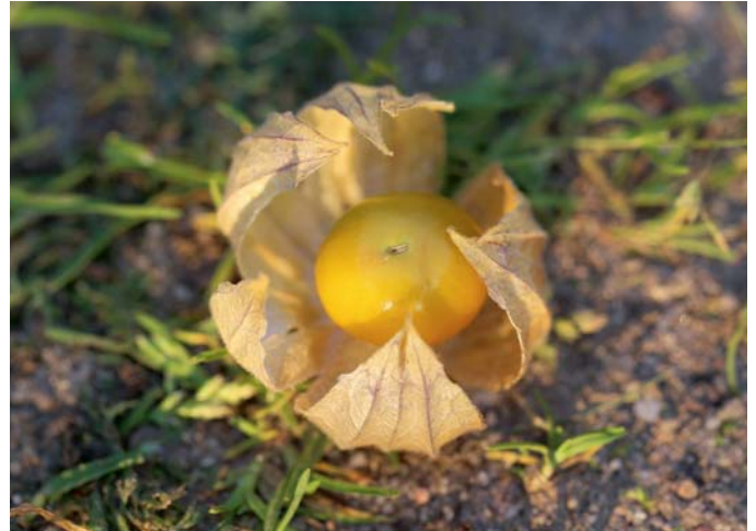
Die geschlossene Blüte der Andenkirsche ist sehr unscheinbar. Rechts: Die Frucht der Andenkirsche ist in reifem Zustand von einer papierartigen Haut umgeben, die aus den Kelchblättern der Blüte gebildet wird.

sen, doch sind ihre Früchte essbar. Allerdings sind sie Saisonpflanzen. Ich meine die Kapstachelbeere ( Physalis peruviana ).