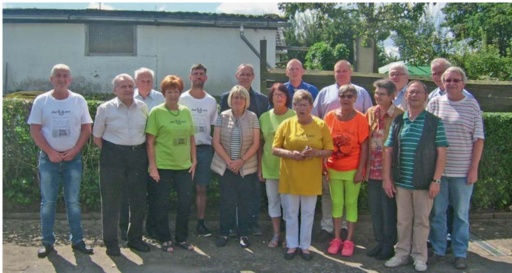
Vereinsjubiläum: 70 Jahre KGV Am St. Annenberg 1947

ein herzliches Dankeschön und bis zu nächsten Feier.