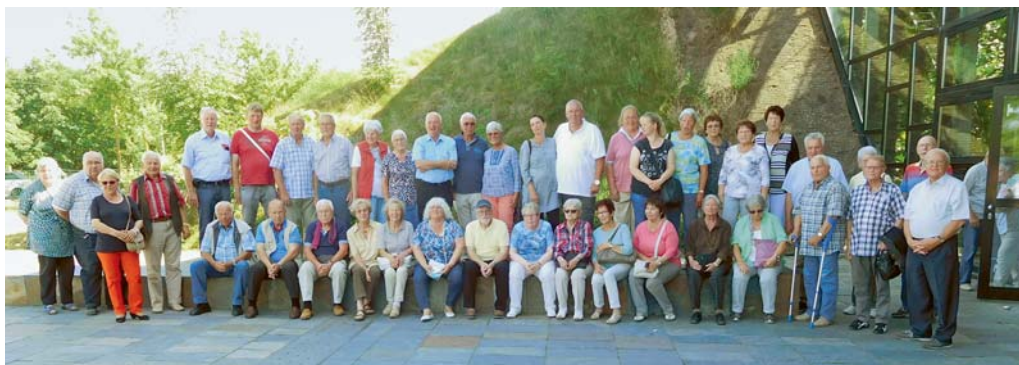
Bezirksverband Steintor: Schulungsfahrt 2017 an der Biosphäre Potsdam