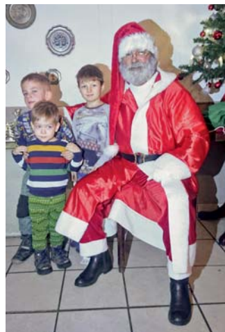
Der Weihnachtsmann legte zur Freude der Kinder auch einen Zwischenstopp im KGV Schlehenhang ein.

Am 04.12.2022 ab 13 Uhr startete die Weihnachtsfeier zunächst für die Kinder mit dem Backen von Keksen. Dabei hatten die elf Kinder sehr viel Spaß, und zwar ganz besonders beim Ausstechen und Verzieren der Kekse. Natürlich wurde