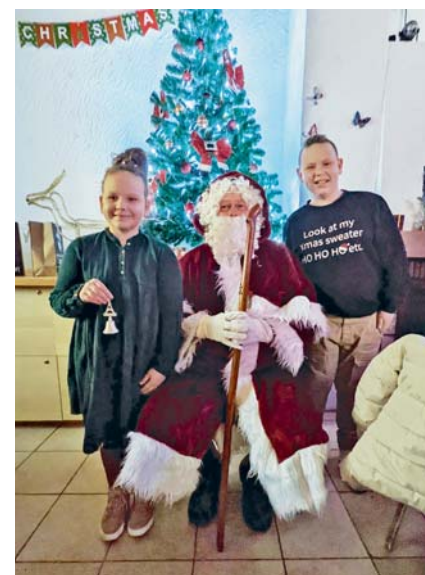
Weihnachtsfeier am 18. Dezember 2022 im KGV Südstadt

Insbesondere langsam wachsende Gemüsesorten wie Auberginen, Paprika und Artischocken sollten jetzt auf der Fensterbank vorgezogen werden, damit sie genug Zeit zum Reifen haben. Robusteres Blattgemüse wie Eisbergsalate, Römersalate oder Endivien, aber auch Spinat und Zwiebeln gedeihen gut, wenn sie im Februar im Gewächshaus oder Frühbeet gesät werden.