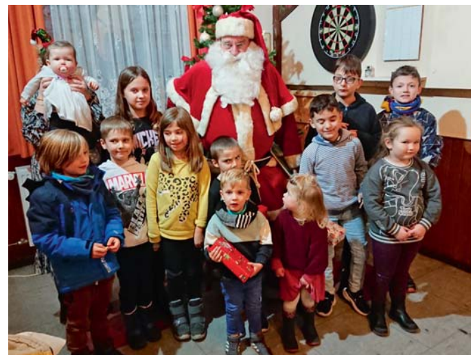
Der Weihnachtsmann zu Gast bei der Weihnachtsfeier des KGV Brodweg

Wer Kübelpflanzen überwintert, kann diese jetzt schon mal auf Schädlinge kontrollieren und auch hier einen Rückschnitt durchführen. Auch Dahlien oder Canna können schon angetrieben werden.