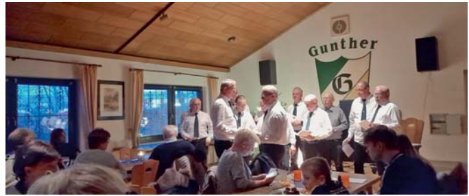
Die Guntheraner sorgten für gute Stimmung bei der Adventsfeier des KGV Gunther.

Denkt bitte daran, die MV ist eine Pflichtveranstaltung, hier kann jeder über die Belange des Vereins mitbestimmen. Die Einladung mit dem Tagesordnungspunkten wird jedem Vereinsmitglied zugeschickt.