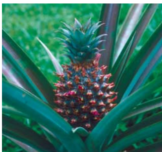
Plantagen-Ananas mit Fruchtsatz auf der Karibik-Insel Martinique. An der Frucht sind noch Reste der kleinen, bläulichen Blüten zu erkennen

Werbung ist heute alles. Sie wird nicht nur für Elektrogeräte gemacht. Auch in den bunten Gartenkatalogen, die uns Anfang des Jahres wieder in Haus „flattern“, ist es häufig schwer, seriöse Gebrauchsinformationen und leichtfertigen Werbeversprechungen auseinander zu halten.