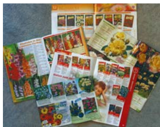
Viele Firmen werben mit farbenfrohen Bildern für Ihre Produkte

Nur allzu gern geben wir uns in der Bestellphase der Illusion hin, dass sich die grelle Blumen- und Farbenpracht der Katalogbilder auch in unserem eigenen Garten zeigen wird. Doch hat nicht jeder von uns schon seine einschlägigen Erfahrungen mit Wunsch und Wirklichkeit, mit den frisierten Pflanzenbildern der Kataloge und dem Aussehen der Pflanzen im eigenen Garten gemacht?