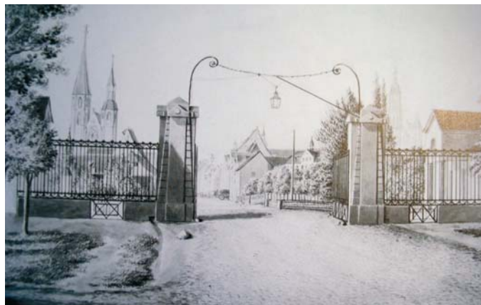
Das alte Fallersleber Tor um 1820. Nach diesem Stadttor in der Fallersleber Straße hat der Bezirk seinen Namen erhalten.