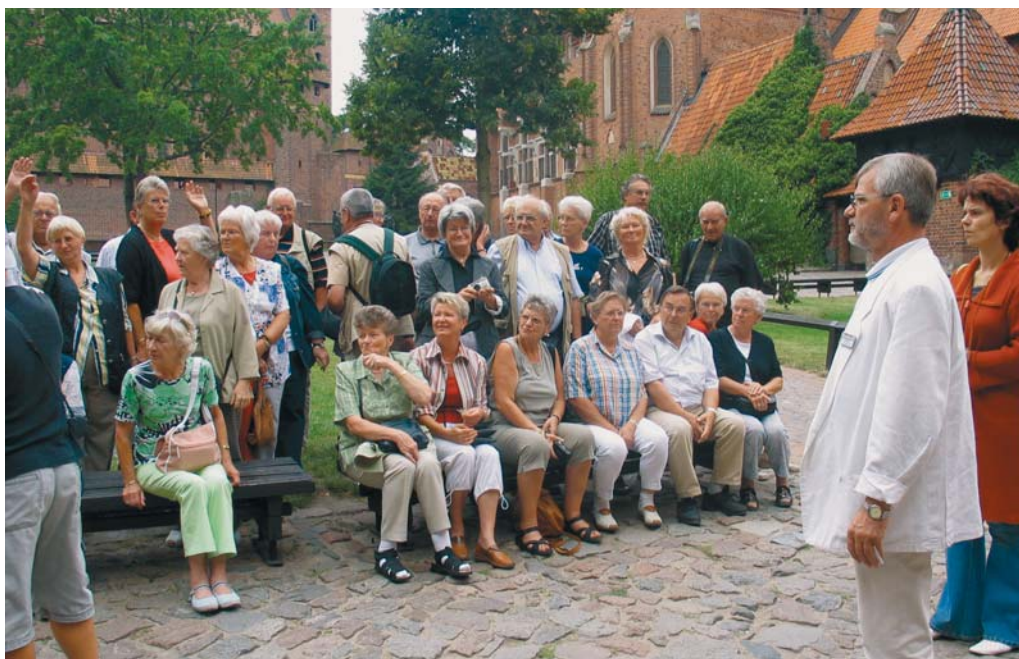
Gartenfreunde des Bezirks Fallerslebertor im September 2001 in Eguisheim im Elsaß