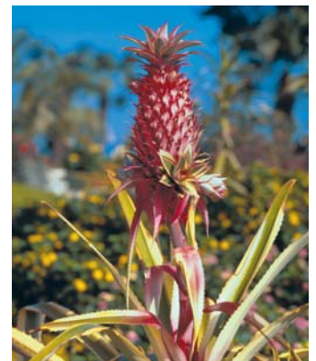
Ananas-Sorten mit weiß-bunten Blättern und roten Früchten sind als Zierpflanzen wesentlich attraktiver – aber auch teurer – als die landwirtschaftlich angebauten Frucht-Sorten, die manchmal im Versandhandel angeboten werden

Die ganze Pflanze schließlich scheint zu einer Art Blumengesteck herangewachsen zu sein. Blüten