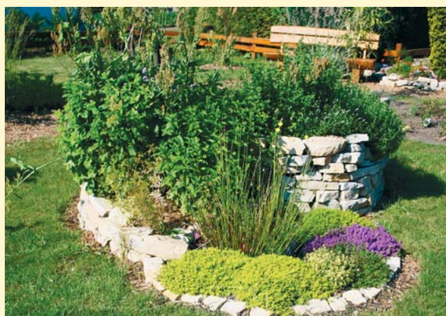
Eine Kräuterspirale ist auch ein herrliches Kleinbiotop

Sonntag, den 22.04. im KGV Immergrün, in Dannenbüttel bei Gifhorn, Thema: „ Tierische Schädlinge an Obst und Pflanzen “. Beginn um 9 Uhr.