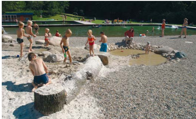
Badeteiche sind in Kleingartenanlagen nicht erlaubt. Wenn es zu heiß wird, dann ab ins Schwimmbad.

Schnell ist der Entschluss gefasst, sich in Vorbereitung auf die heiße Jahreszeit mit einem Abkühlung versprechendem Medium einzudecken. Doch Achtung. Auf die Größe kommt es an. Vor der Anschaffung eines Beckens sollten Sie in Ihren Einzelpachtvertrag schauen und mit Ihrem Vorstand sprechen. Kleingärten sind durch die Nutzungsbestimmungen nach dem Bundeskleingartengesetz und den entsprechenden Regelungen im Pachtvertrag im Rahmen der „kleingärtnerischen Nutzung“ eingeschränkt. Das heißt, bauliche Einrichtungen müssen der vertragsgemäßen Nutzung dienen.