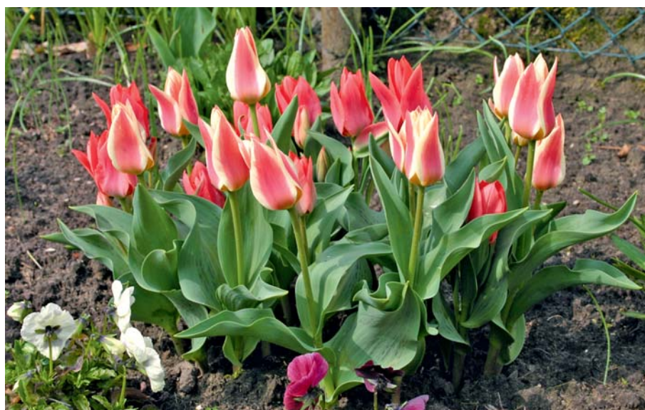
Früh blühende Tulpen, wie die Greigii- und Kaufmanniana-Hybriden, werden oft auch als Botanische Tulpen bezeichnet.

Alle hier vorgestellten Wildtulpen brauchen einen Platz an der Sonne in mäßig gedüngter Erde und garantieren, wenn sie in Ruhe wachsen, über Jahre hinweg einen ausdauernden Blütenflor. An günstigen Standorten können sie sich durch die Bildung von Tochterzwiebeln im Laufe der Zeit gut vermehren. ➤