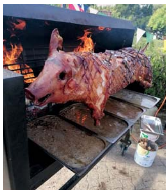
Das Spanferkel auf dem Grill beim Gartenfest KGV Am Mühlenbach