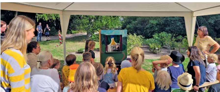
Gespannt verfolgten die Kinder den Auftritt der Puppenspielerin.

Vorsitzender des Landesverbands Braunschweig der Gartenfreunde