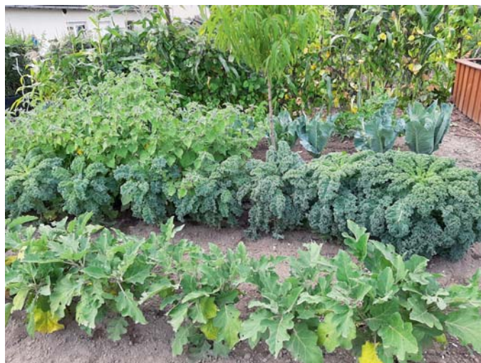
KGV Lindenberg IV: Ein vorbildliches Gemüsebeet im Garten 79, das die Vorfreude auf die Ernte weckt.

Die Grünschnittcontainer stehen wie gewohnt hinter dem Vereinsheim bereit. Über Anmeldungen für die Gemeinschaftsarbeit freut sich Gfr Maic Hering bis eine Woche vor dem Termin. Nach dem letzten Aufruf zur Gemeinschaftsarbeit haben sich erfreulicherweise 20 Gartenfreunde gemeldet, das hält den aktuellen Rekord. Unter anderem wurde der Parkplatz gesäubert und die Arbeiten im Vereinsheim haben Fahrt aufgenommen. Das Wasser wird je nach Witterung abgestellt.