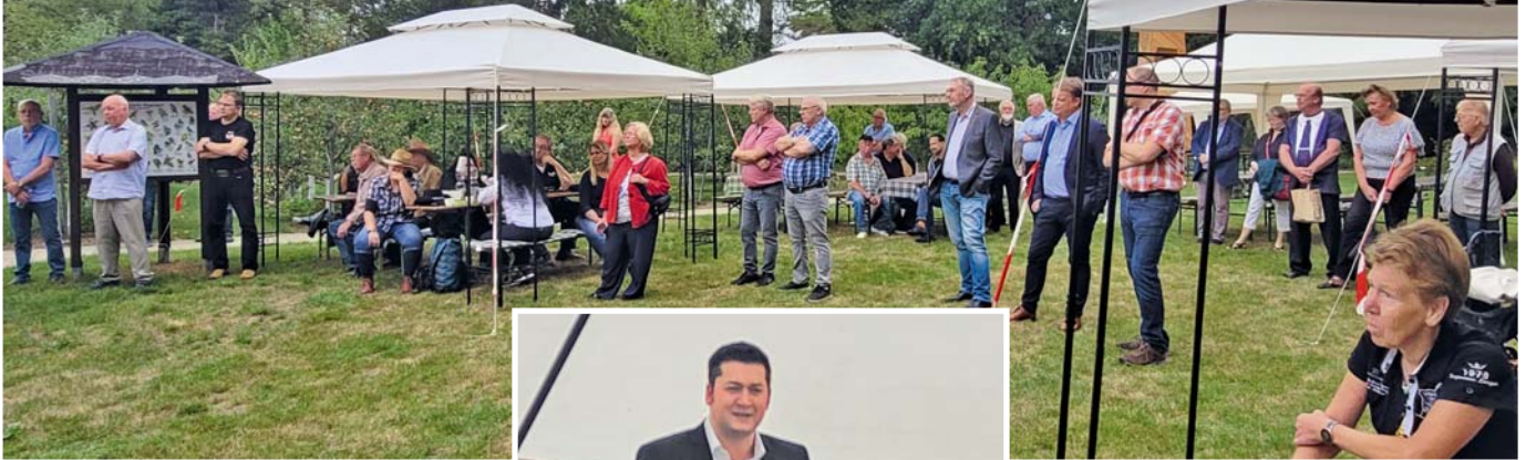
Zahlreiche Gäste waren zur Feier erschienen.