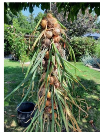
Ernteerfolge im KGV Südstadt: Ein Zwiebelzopf, frisch aus dem Garten

Termine: Gemeinschaftsarbeit am 08.10. und 22.10. von 8:30 bis 12:30 Uhr; das Wasser wird am 05.11. abgestellt.