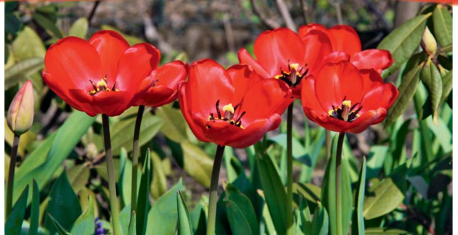
Rote Tulpen bringen Farbe in den Frühling.