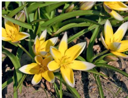
Die Blüten der Zwerg-Stern Tulpe leuchten im geöffneten Zustand, geschlossen sind sie eher unscheinbar.