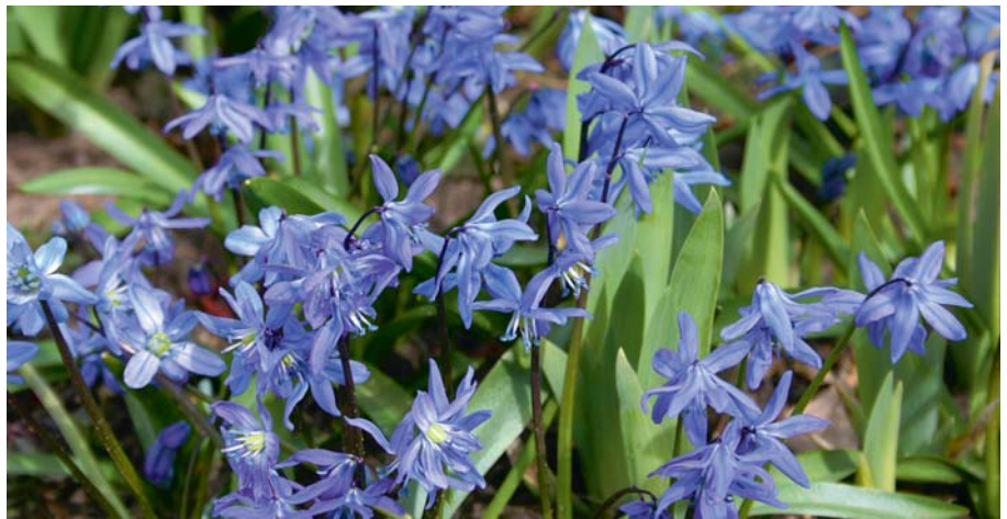
Viele kleinere Zwiebelpflanzen, wie hier das Blausternchen, bilden mit der Zeit Tochterzwiebeln und können sich dadurch über Jahre auf größeren Flächen ausbreiten.

Die verschiedenen Zwiebelschichten enthalten die Nährstoffe, die die Zwiebel im jeweiligen Jahr zum Wachsen und Blühen braucht. Ist eine Zwiebel ausgeblüht, sind ihre Speicher normalerweise verbraucht. Sie kann sie nur durch Photosynthese in ihren grünen Blättern wieder auffüllen oder Tochterzwiebeln ausbilden. Deshalb ist es wichtig, das Laub so lange an der Pflanze zu lassen bis es gelb geworden ist. Erst dann hat die Pflanze ihre Speicher wieder aufgefüllt. Die sich nach der Blüte bildenden Fruchtstände sollten jedoch abgeschnitten werden, damit die Pflanze ihre Kräfte nicht in die Samen steckt, sondern in die unterirdischen Zwiebeln.