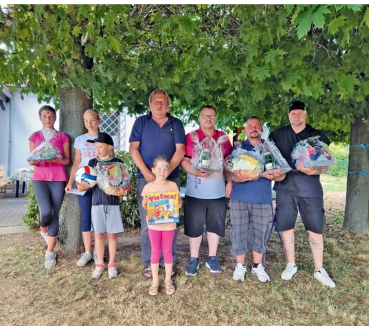
Einige Gewinner vom Sommerfest des KGV Sonnenland

Termine: 08.10., 9–13 Uhr, Gemeinschaftsarbeit; 29.10., 9–13 Uhr; Abstellen des Brauchwassers, ab 16 Uhr Abgrillen und Lagerfeuer vor dem Vereinshaus.