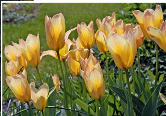
Die pastellfarbenen Blüten der Greigii-Hybride 'Für Elise' wirken sehr apart.

innen gelb und außen rot-gelb. 'Toronto' blüht leuchtend orange. Sie hat zwar keine großen Blüten, jedoch mehrere an einem Stiel – das ist bei Gartentulpen eher untypisch.