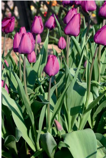
Tulpen haben ein breites Farbspektrum von Weiß über Gelb und Rot bis Violett und allen Nuancen dazwischen. Nur Blau gibt es bei den Tulpenblüten nicht. Rechts: Eine besonders elegante, schmale Blütenform haben die Lilienblütigen Tulpen.

Jetzt wird die Erde wieder in das Loch gefüllt, mit dem Harkenrücken leicht ange-drückt und glattgeharkt. Ist ein Schildchen in der Packung, sollte man es dazu stecken, damit man weiß, wo welche Zwiebeln eingegraben wurden. Es empfiehlt sich, Tulpen