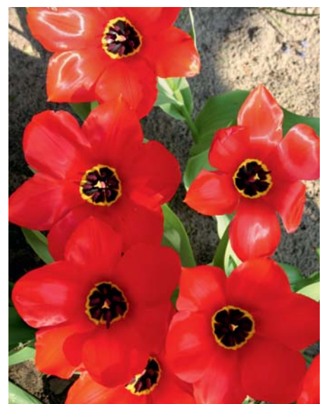
Greigii-Hybride weisen am Grund der Blüte einen schwarzen Basalfleck mit gelbem Rand auf.