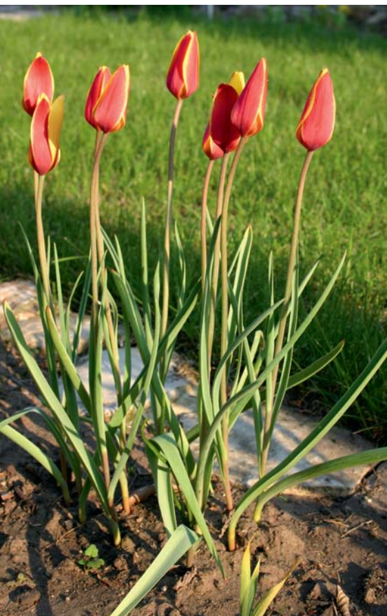
Die grazilen Damentulpen passen sehr gut in trockene Bereiche wie den Steingarten

ten Jahr fällt die Blüte nicht mehr so üppig aus, und ab dem dritten Jahr ist die Blüte kaum noch der Rede wert. Wer also große Blüten bevorzugt, der sollte jedes Jahr die Gartentulpen neu pflanzen.