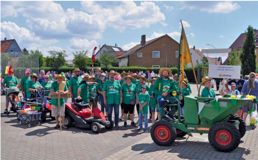
KGV Erholung: Unsere Aufstellung zum großen Festumzug „1000 Jahre Vöhrum“