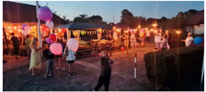
KGV Vogelsang: Der Fackellauf war einer der Höhepunkte des Sommerfestes.

Am 02.07. feierten wir unser Vereinsommerfest mit zahlreichen Gartenfreunden, Familien und Besuchern. Ein buntes Kinderprogramm, eine Feuershow und ein