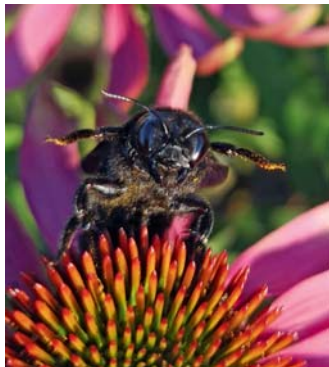
KGV Webersche Sandgrube: Holzbiene auf Echinacea