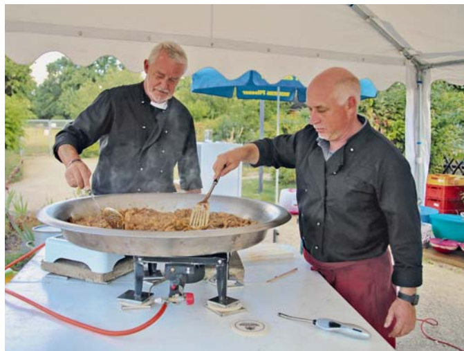
Gelungenes Straßenfest des KGV Gunther