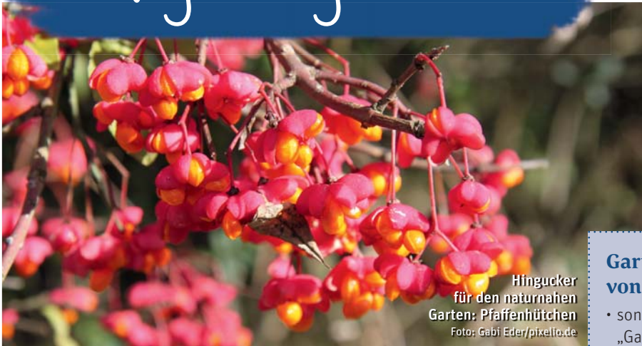
Hingucker für den naturnahen Garten: Pfaffenhütchen