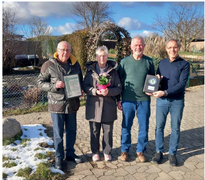
SGV Goldene Aue: Ehrung der langjährigen Mitglieder

Das Jahr 2022 war ein gutes Jahr. Der Vorstand bedankte sich bei allen Mitgliedern für das Engagement im Verein. Der Vorstand gratuliert