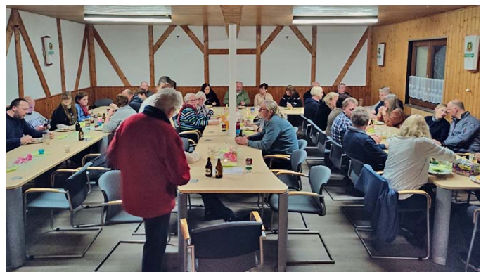
Grünkohlessen in der Kantine des SGV Am Harbker Weg 1926