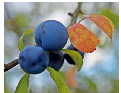
Winternahrung für viele Gartenvögel: Schlehenfrüchte