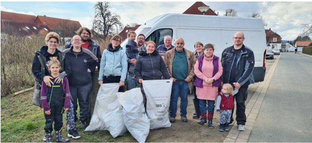
KGV Ringelheim macht mit bei „Salzgitter putzt sich“

nochmal an alle Helfer, es war ein toller und erfolgreicher Tag!