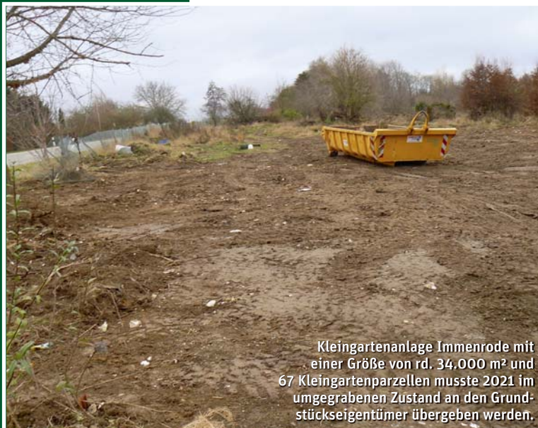
Kleingartenanlage Immenrode mit einer Größe von rd. 34.000 m 2 und 67 Kleingartenparzellen musste 2021 im umgegrabenen Zustand an den Grundstückseigentümer übergeben werden.

Geschäftsführer des Landesverbandes Braunschweig der Gartenfreunde e.V.