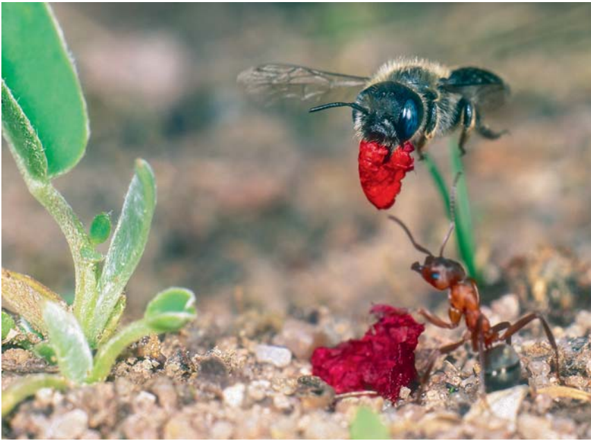
Grafik: Stiftung für Mensch und Umwelt, Dominik Jentzsch