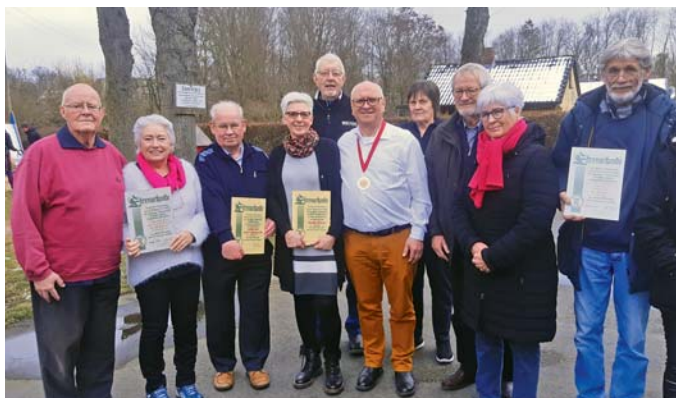
Die geehrten Gfr des KGV Mutterkamp nach der Jahreshauptversammlung