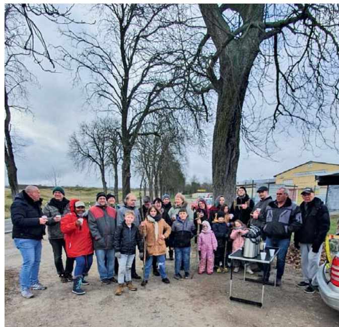
SGV Negenborn: Die Braunkohlwanderung war ein voller Erfolg!