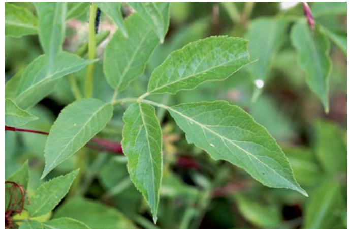
Das Blatt des Holunders ist wie bei der Rose fünfzählig und unpaarig gefiedert.

Aus den Holunderbeeren wurden früher Säfte, Gelees und Marmeladen gekocht. Durch den hohen Vitamin-C-Gehalt fand der Fliederbeersaft, heiß und mit Honig gesüßt, schon bei unseren Großmüttern als Stärkungsmittel bei Erkältungen Verwendung. Studien haben gezeigt, dass Ho-