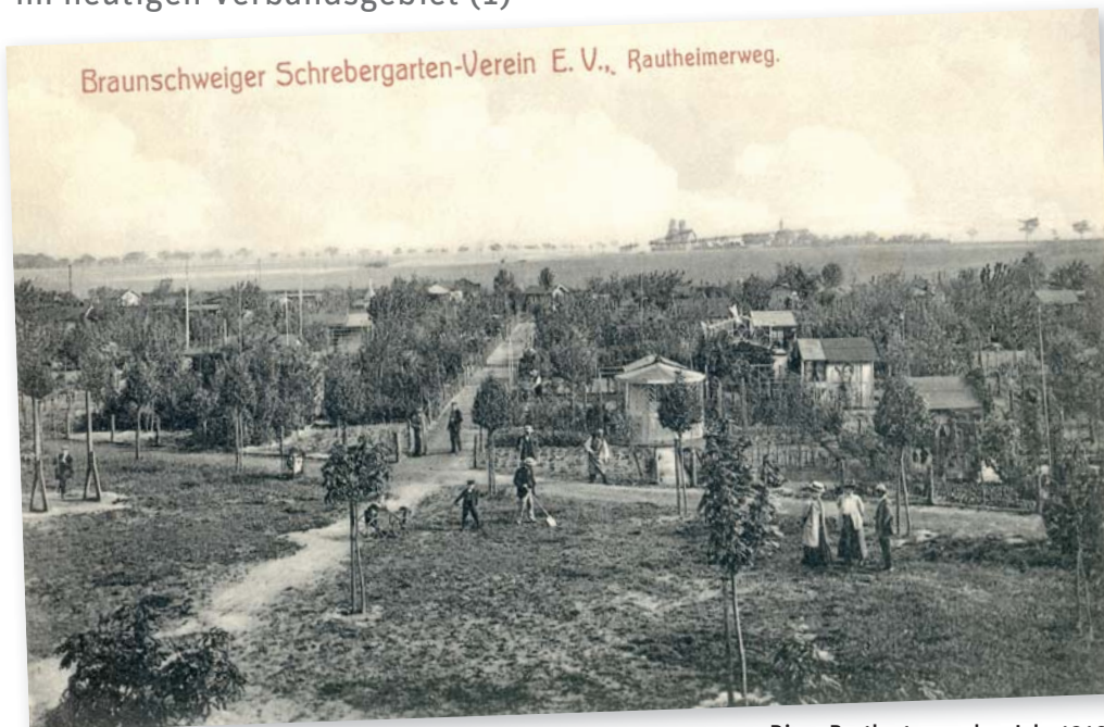
Diese Postkarte aus dem Jahr 1910 zeigt einige Parzellen des Braunschweiger Schrebergartenvereins von 1903 e.V.

Die historische Entwicklung des Kleingartenwesens im heutigen Verbandsgebiet (1)