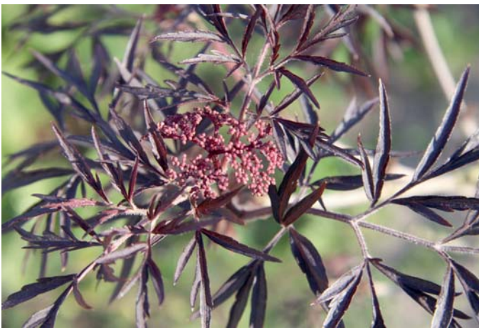
Die Sorte 'Black Lace' hat mit ihrem geschlitzten Laub einen hohen Zierwert. Hier ist der Austrieb noch ganz jung und die Blütenrispe noch sehr klein. Später werden die Blüten in kräftigem Rosa blühen und nach Zitrone duften.

In Norddeutschland kocht man aus den Beeren eine Fliederbeersuppe oder man verwendet sie als Zutat in ‚Roter Grütze‘. Die Beeren kann man problemlos einfrieren und nach Bedarf verarbeiten. Der Saft der Beeren ist