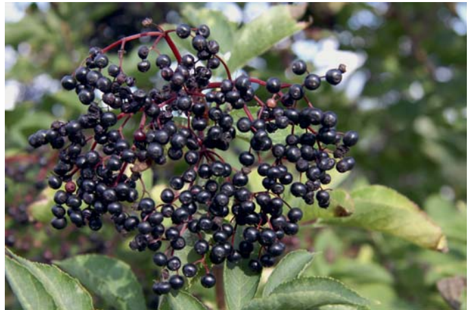
Die reifen Früchte des Holunders sind roh nicht genießbar. Gekocht als Saft, Marmelade oder Gelee sind sie jedoch ein Genuss.