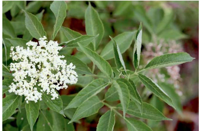
Vor dem kräftig grünen Laub fallen die Blütenstände des Holunders auf.