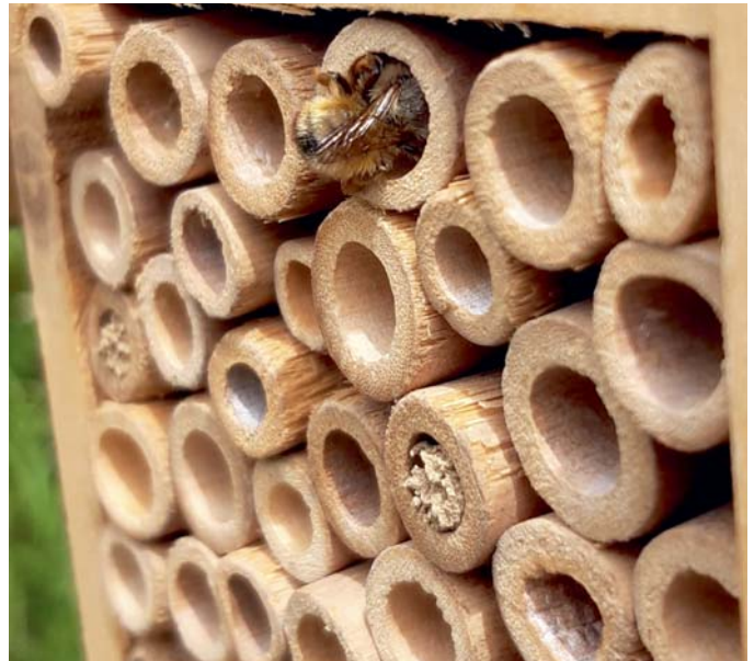
KGV Am Weinberg: Einige Gfr haben ein Insektenhotel und ein Hummelhaus im Garten aufgebaut, die auch schon bezogen werden.

Einige Gfr haben ein Insektenhotel oder auch ein Hummelhaus im Garten aufgebaut, diese werden von den Wildbienen und Insekten schon sehr gut angenommen. Da viele Gfr bienen- und insektenfreundliche Blumen anpflanzen, summt und brummt es in den Gärten.