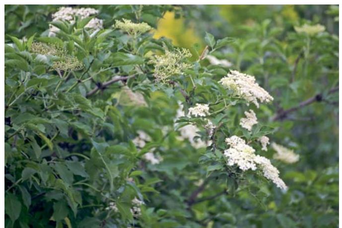
Bei größeren Exemplaren bekommen die Zweige einen überhängenden Wuchs, d.h. sie neigen sich in einem Bogen nach unten.

lunder-Extrakte ein wirksames Mittel zur Behandlung grippaler Infekte sind.