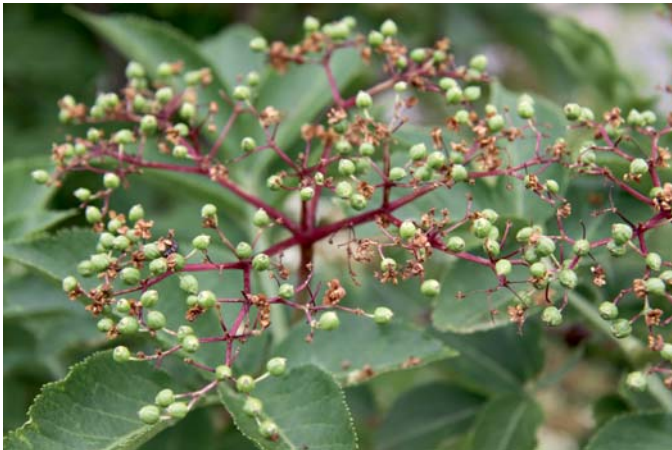
Nach der Bestäubung durch Insekten bilden sich die Beeren aus. Zum Reifen brauchen sie etwa drei Monate.

besser geeignet. Sie sind so nützlich wie ihr wilder Verwandter, denn die Blüten und die Früchte kann man auch in der Küche verwenden. Man muss sich nur an die etwas andere Farbe des Laubs gewöhnen.