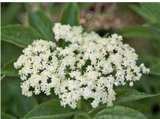
Der Blütenstand ist eine Schirmrispe, die aus vielen kleinen Blütchen zusammengesetzt ist. Sie haben einen ganz typischen, angenehmen Duft.

In der heutigen Zeit muss man auch im Kleingarten nicht auf Holundersträucher verzichten,