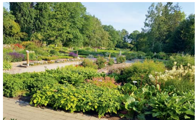
Auch wenn die Geschäftsstelle geschlossen ist, so lädt der Lehr- und Versuchsgarten des Landesverbandes zum Verweilen ein.

Die Geschäftsstelle des Landesverbandes ist in der Zeit vom 06.07. bis einschließlich 24.07.2020 geschlossen. Während dieser Zeit finden keine Vorstandssprechtage statt.