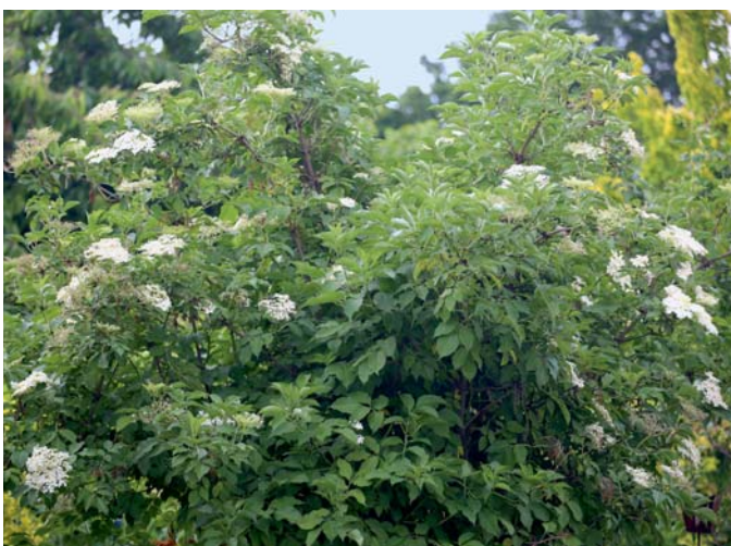
Die bei uns in der Natur wachsenden Holundersträucher können bis zu 10 m hoch werden.

man einmal über die Kultur nachdenken, denn der Saft oder die Marmelade schmecken ganz hervorragend und sind im Handel kaum erhältlich. Und eine selbst gemachte Marmelade schmeckt doch immer besser als eine gekaufte.