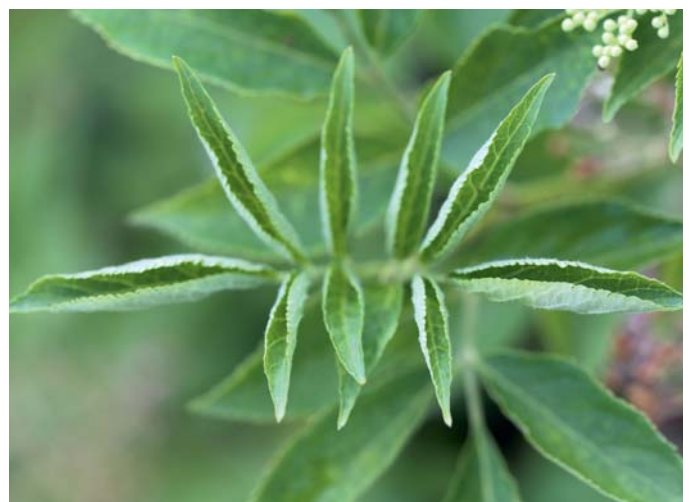
Um sich vor starker Sonneneinstrahlung zu schützen, sind die jungen Blätter an der Triebspitze zusammengerollt.