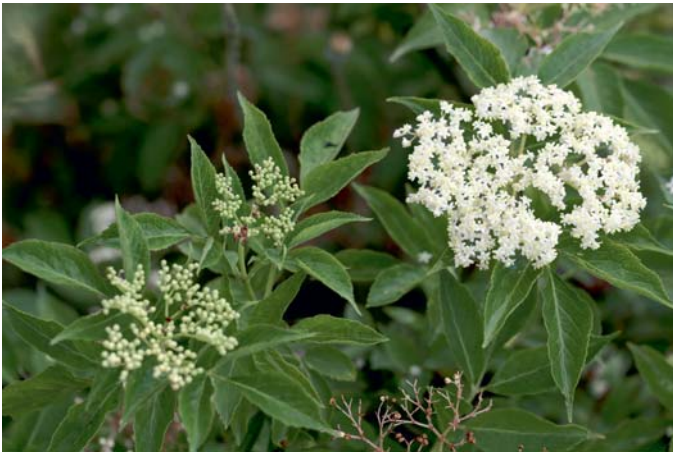
Die Blütenrispen des Holunders sind sehr reich an Nektar und Pollen und deshalb eine gute Insektenweide.