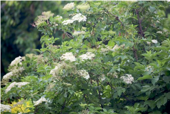
Die Blüte des Schwarzen Holunders zeigt uns den Beginn des Frühlommers an.