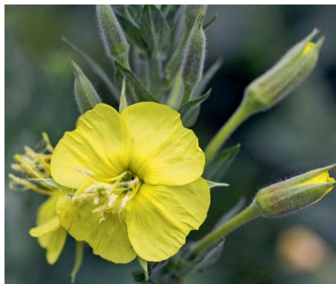
Die zweijährige Nachtkerze öffnet in den frühen Abendstunden ihre Blüten und lockt damit viele nachtaktive Insekten an.