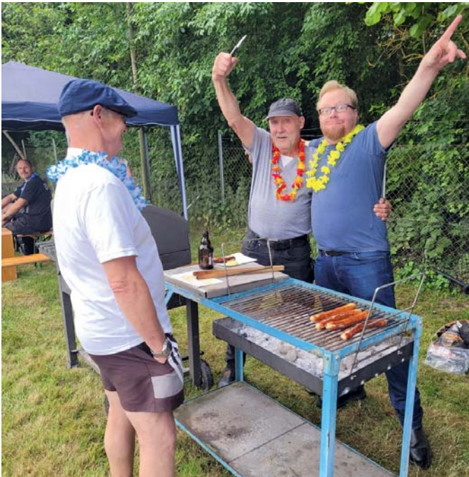
Die „Griller“ des KGV Asseblick hatten trotz der Temperaturen viel Spaß

sammelt hatte, auf den wartete eine kleine Überraschung.