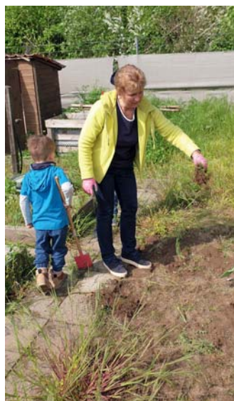
KGV Heideland: Was man im Garten doch entdecken kann!