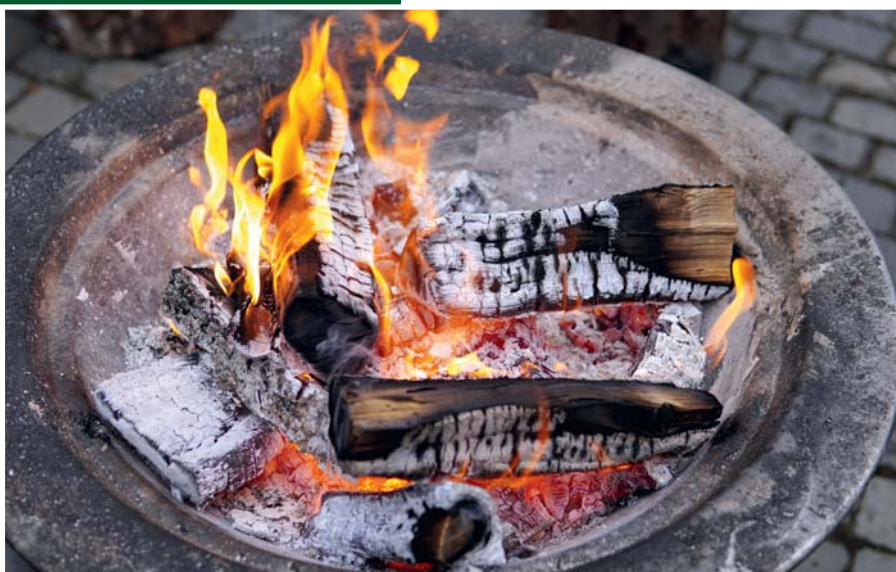
Genehmigungsfreie Feuerschale mit einem Durchmesser unter einem Meter

Zu beachten sind auch die Wetterbedingungen; bei starkem Wind oder bei extremer Trockenheit ist auf ein Feuer zu verzichten. Das Feuer darf niemals unbeaufsichtigt sein! Bevor die Feuerstelle verlassen wird, muss sichergestellt sein, dass das Feuer ausnahmslos erloschen ist. Nachdem die Asche vollständig abgekühlt ist, kann diese in kleinen Mengen dem Kompost beigemischt werden. ➤