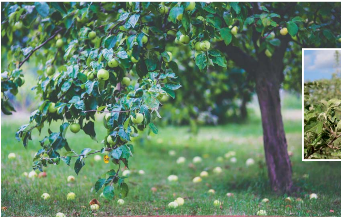
Nur gesunde Bäume liefern gute Erträge.