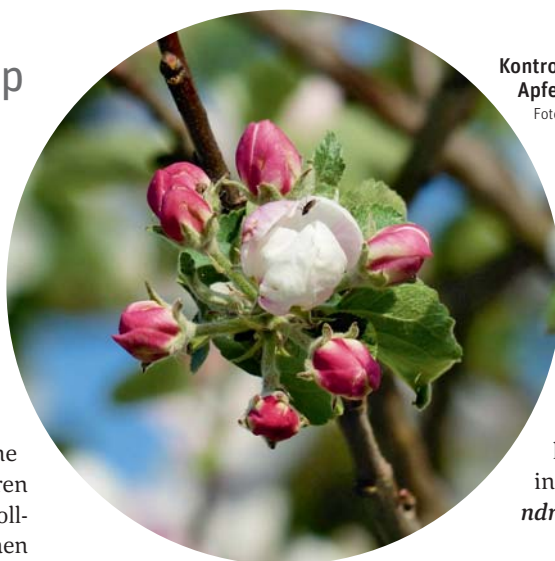
Kontrollieren Sie die Blüten und Knospen Ihres Apfelbaumes im Frühjahr auf Mehltaubefall.