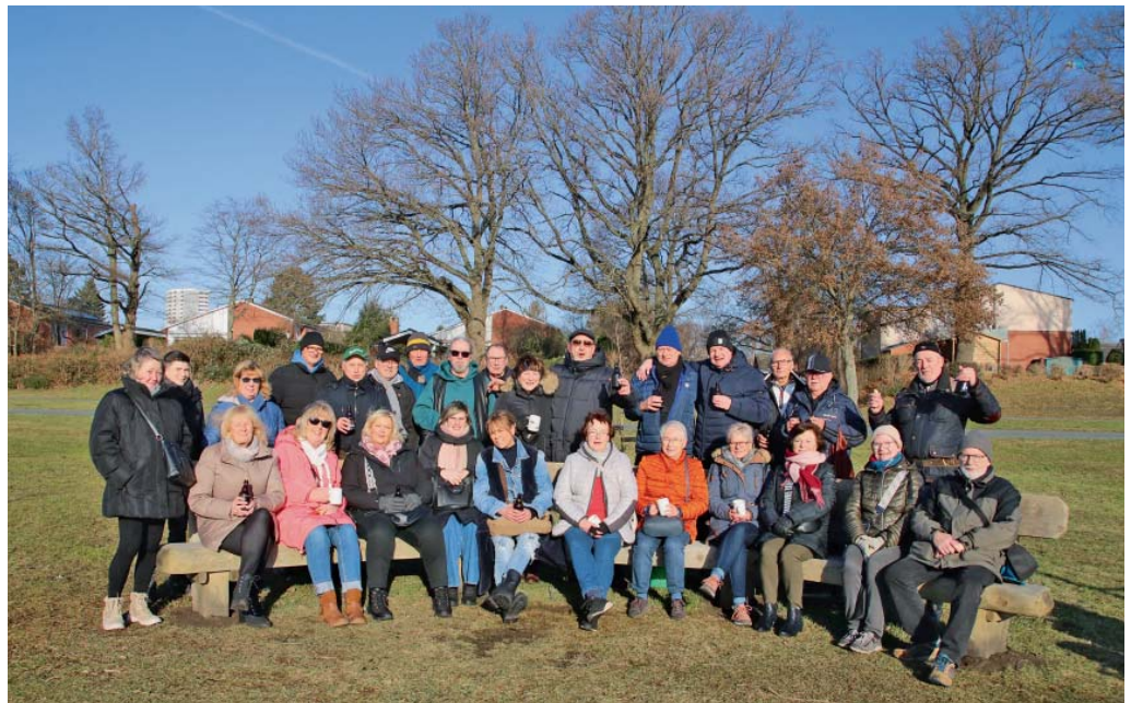
Braunkohlwanderung des KGV Gunther

Termine: 13.04., Gemeinschaftsar-beit mit Container. Schon mal vor-merken: am 01.05. ist unser Mai-baumfest.