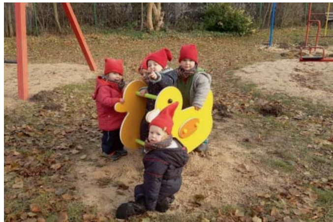
Der neu gestaltete Spielplatz im KGV Mutterkamp

Die Kinder waren traurig. Im letzten Frühjahr musste die beliebte Federwippe von unserem Spielplatz abgebaut werden. Aus Sicherheitsgründen durfte die betagte Wippe nicht mehr genutzt werden. Auch das Dach des Kinderspielhauses zeigte deutliche Altersspuren. Aus eigenen Mitteln konnten wir die Neuanschaffung und die Reparatur nicht stemmen. Dank der großzügigen Unterstützung der Bürgerstiftung Braunschweig und der Braunschweigischen Sparkassenstiftung